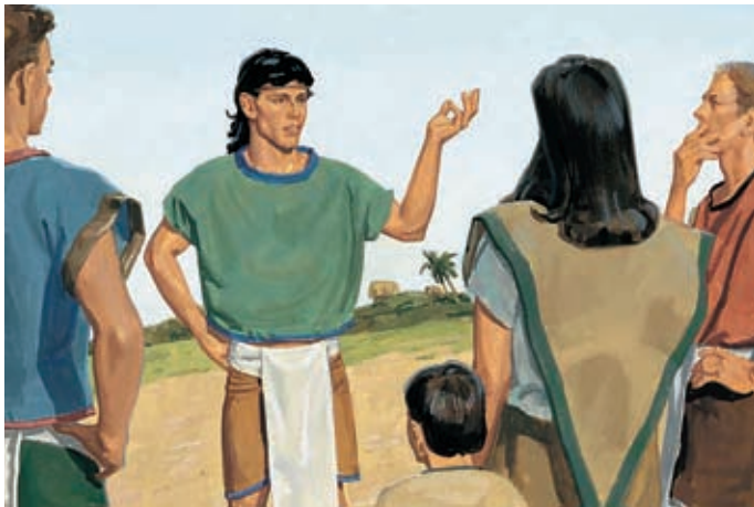
Egli aveva cercato di insegnare loro ad avere speranza grazie all'espiazione di Gesù Cristo e ad avere carità, che è il puro amore di Cristo. Moroni 7:40–41, 47