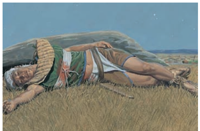
I Lamaniti uccisero Mormon e tutti i Nefiti eccetto Moroni, il quale terminò di scrivere gli annali. Mormon 8:2–3