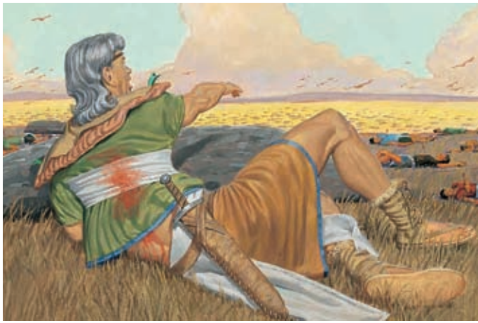
Mormon era rattristato che tanti Nefiti fossero morti, ma sapeva che essi erano morti perché avevano respinto Gesù. Mormon 6:16–18