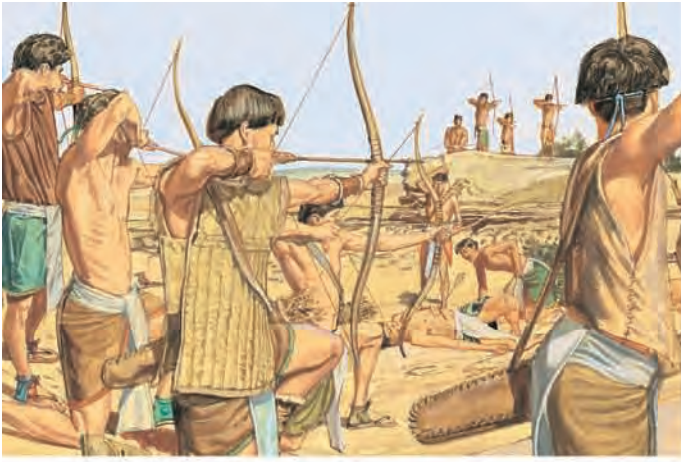
Quando Mórmon tinha onze anos de idade, deu-se início a uma guerra entre nefitas e lamanitas. Os nefitas venceram, e houve paz mais uma vez. Mórmon 1:6, 8–12