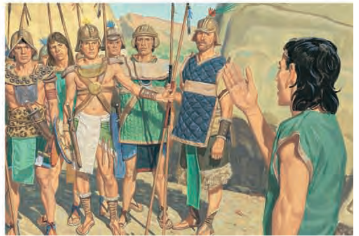
Os nefitas lutaram contra os lamanitas por muitos anos. Mórmon incentivava seu povo a lutar pela família e pelo lar. Mórmon 2:23