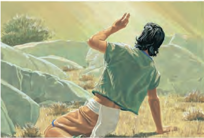
Quando Mórmon tinha quinze anos de idade, Jesus Cristo visitou-o. Mórmon aprendeu mais a respeito do Salvador e de Sua bondade. Mórmon 1:15