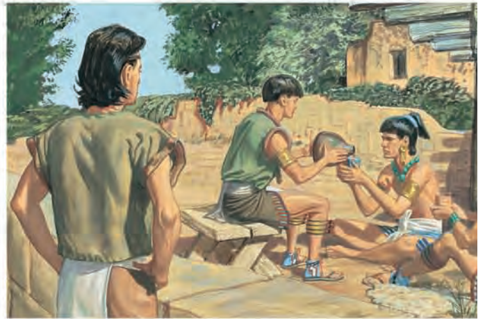
Mórmon queria pregar ao povo, mas Jesus disse-lhe que não fizesse isso, pois o povo era muito perverso. O coração deles estava voltado contra Deus. Mórmon 1:16–17