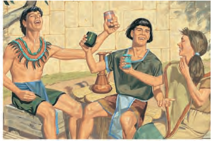
Mas os nefitas eram tão iníquos que o Senhor retirou os três discípulos dentre eles, assim cessaram-se os milagres e as curas. O Espírito Santo não orientou mais o povo. Mórmon 1:13–14