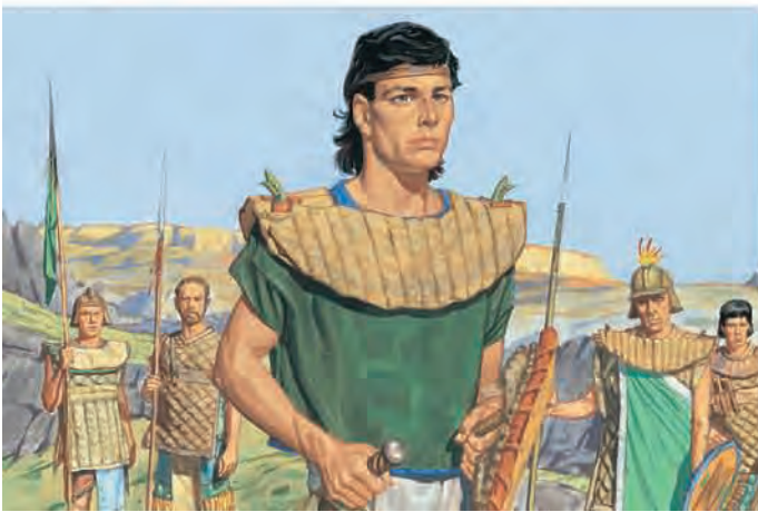
Pouco tempo depois, começou uma outra guerra. Mórmon estava grande e era forte. Os nefitas escolheram Mórmon para liderar o exército. Mórmon 2:1