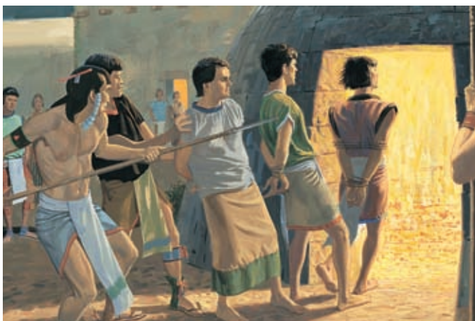
Когда их бросали в печи и в логова с дикими зверями, их тоже защищала сила Божья. 3 Нефий 28:21–22