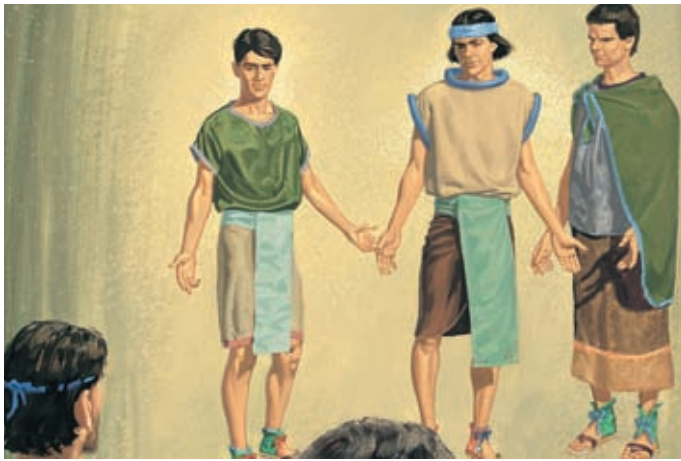
Трое учеников были взяты на Небо, где они увидели и услышали много замечательного. Они стали лучше понимать Божественное. 3 Нефий 28:13, 15