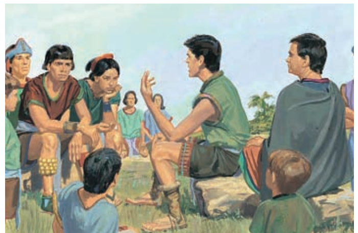
Les trois disciples continuent à prêcher l'Évangile de Jésus-Christ aux Néphites. Ils sont encore en train de prêcher son Évangile. 3 Néphi 28:23, 27–29