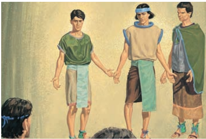
Les trois disciples sont enlevés au ciel, où ils voient et entendent beaucoup de choses merveilleuses. Ils sont mieux capables de comprendre les choses de Dieu. 3 Néphi 28:13, 15