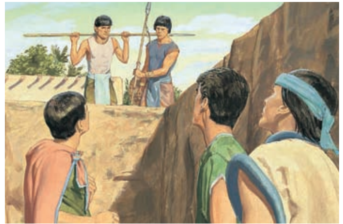
Les Néphites méchants jettent les trois disciples en prison et dans des puits profonds, mais le pouvoir de Dieu les aide à s'échapper. 3 Néphi 28:19–20