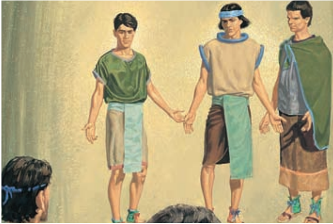
Die drei Jünger wurden in den Himmel entrückt, wo sie viel Wunderbares sahen und hörten. Danach konnten sie das, was von Gott ist, besser verstehen. 3 Nephi 28:13,15.