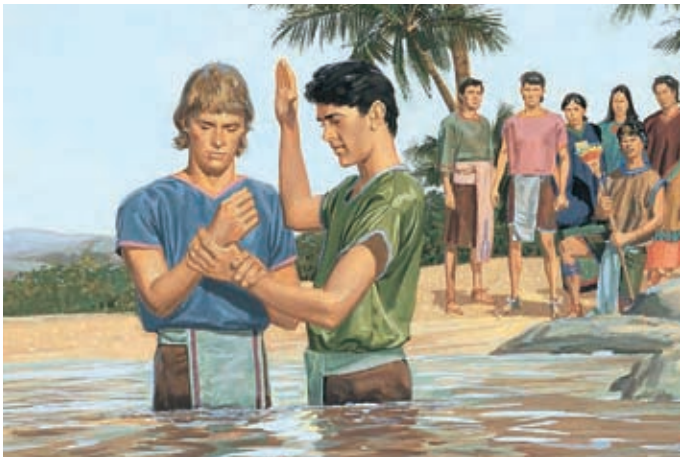
Dann kehrten die drei Jünger auf die Erde zurück und fingen an zu predigen und zu taufen. 3 Nephi 28:16,18.