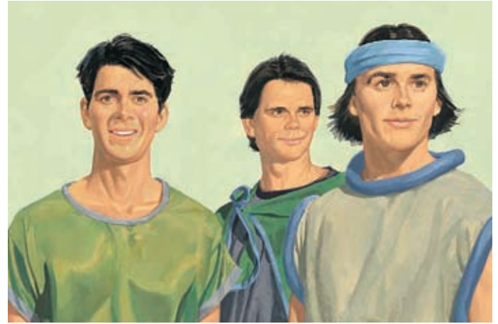
Ihr Körper hatte sich so verändert, daß sie nicht zu sterben brauchten. 3 Nephi 28:15.