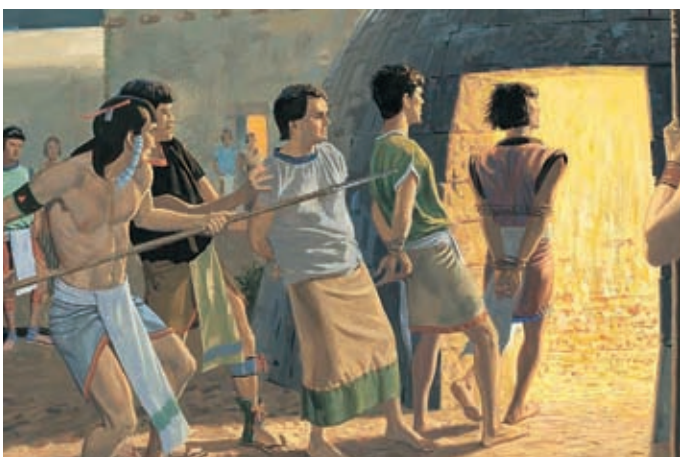
Auch als sie in den Feueröfen und in Gruben mit wilden Tieren geworfen wurden, beschützte Gott sie durch seine Macht. 3 Nephi 28:21,22.