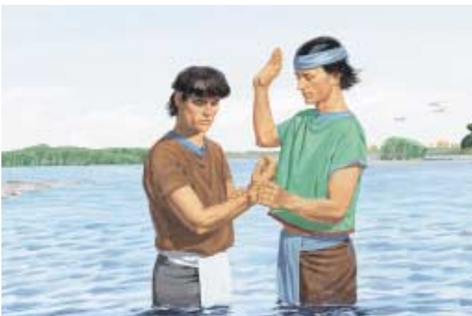
예수님께서 승천하시고 나자 제자들이 백성들을 가르쳤습니다. 믿음을 가진 사람들은 침례를 받고 성신을 받았습니. 제3니파이 26:15, 17