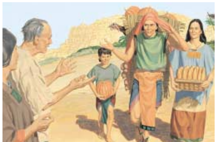
니파이 백성들은 모든 계명에 순종했습니다. 제3니파이 26:20