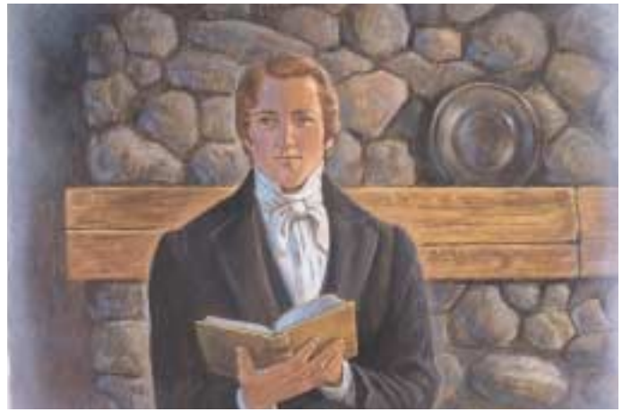
예수 그리스도께서는 후일에 그분의 복음이 지상에 다시 주어질 것이라고 니파이 백성들에게 말씀하셨습니다. 제3니파이 21:1, 3, 7, 9