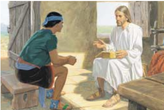
예수님은 니파이 백성들에게 경전을 공부하라고 명하시고 니파이로 하여금 레이맨인 사무엘이 예언한 것이 모두 이루어졌음을 기록하게 하셨습니다. 제3니파이 23:1, 9~13