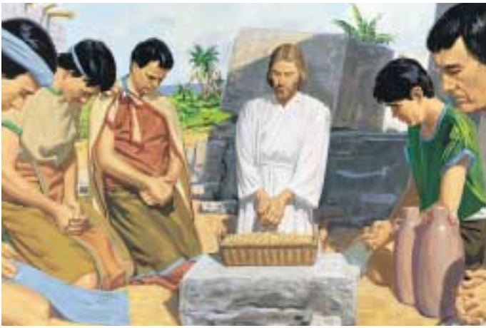
무리 가운데 떡이나 포도주를 가져온 자가 없었습니다. 그러나 구주께서 기적을 일으키시어 떡과 포도주를 제공하셨습니다. 제3니파이 20:6~7