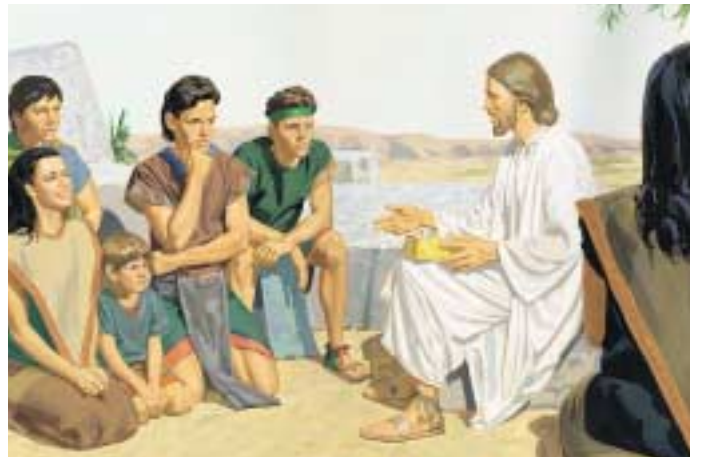
그리고 나서 예수께서는 경전을 백성들에게 설명하여 가르치시고 이를 서로에게 가르치라고 명하셨습니다. 제3니파이 23:14