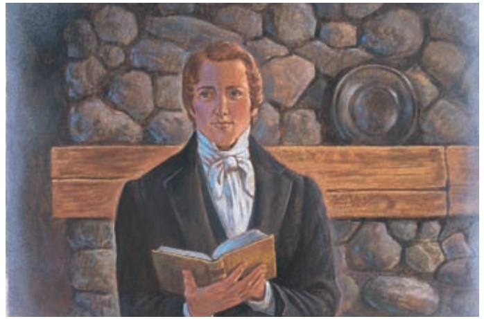
Gesù Cristo disse ai Nefiti che il Suo Vangelo sarebbe stato riportato sulla terra negli ultimi giorni. 3 Nefi 21:1, 3, 7, 9