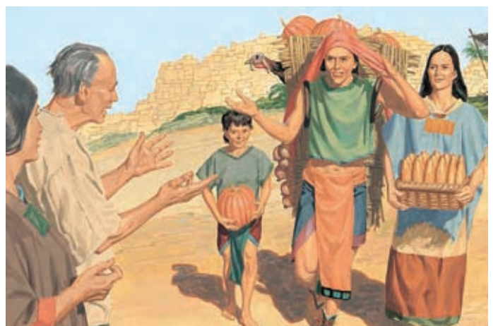
I Nefiti cominciarono ad obbedire a tutti i comandamenti. 3 Nefi 26:20