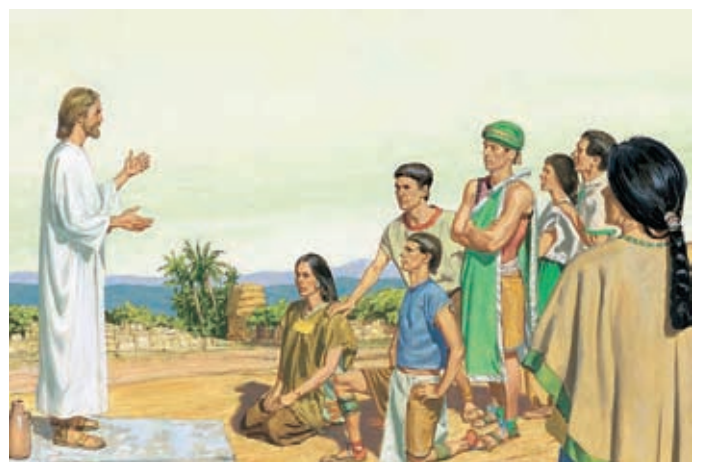
Cristo disse alla moltitudine di cessare di pregare, ma di continuare a pregare nel loro cuore. Quindi dette loro il sacramento. 3 Nefi 20:1-5