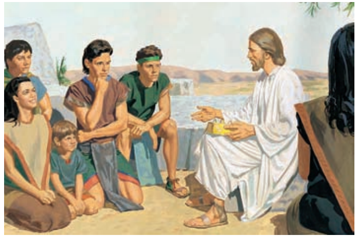
Poi Gesù ammaestrò il popolo citando le Scritture. Disse loro di insegnarsi a vicenda le cose che Egli aveva insegnato loro. 3 Nefi 23:14