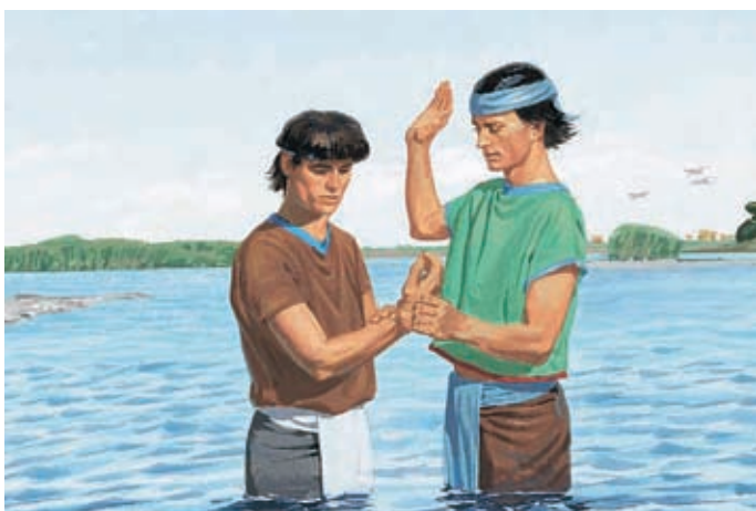
Gesù risali al cielo e i Suoi discepoli cominciarono ad ammaestrare le persone. Coloro che credevano venivano battezzati e ricevevano lo Spirito Santo. 3 Nefi 26:15, 17