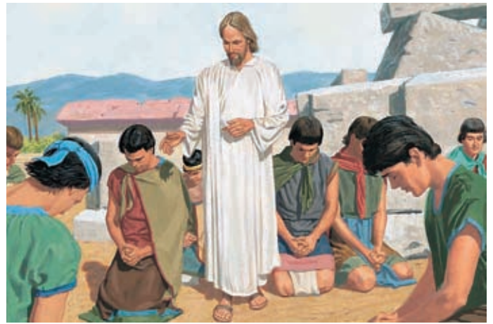
Gesù benedisse i Suoi discepoli mentre pregavano. Egli sorrise loro, ed essi diventarono bianchi come il volto e le vesti del Salvatore. 3 Nefi 19:25