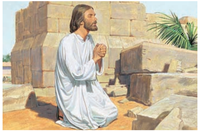
Mentre pregavano, Gesù si allontanò un poco dalla moltitudine e si inginocchiò per pregare il Padre celeste. 3 Nefi 19:18-20