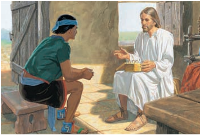
Egli disse loro di studiare le Scritture e fece scrivere a Nefi negli annali l'adempimento del resto delle profezie di Samuele il Lamanita. 3 Nefi 23:1, 9-13