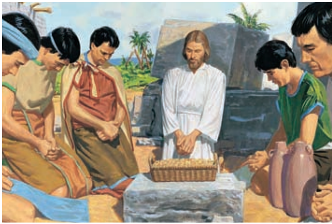
Nessuno aveva portato pane o vino, ma il Salvatore li procurò in maniera miracolosa. 3 Nefi 20:6-7