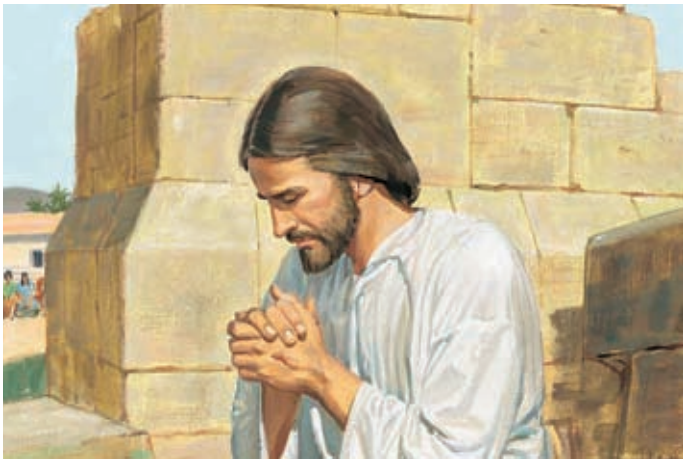
Gesù ringraziò il Padre celeste per aver dato lo Spirito Santo ai Suoi discepoli. Poi chiese che lo Spirito Santo fosse dato anche a chiunque avesse creduto alle parole dei discepoli. 3 Nefi 19:20-21