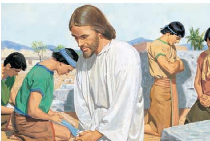
耶穌再一次為祂的門徒祈禱；祂因他們極大的信心而喜悅。 尼腓三書19：29，35