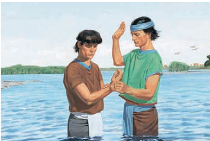
耶穌回到天上，祂的門徒去教導人民。那些相信的人都受洗了，也接受了聖靈。