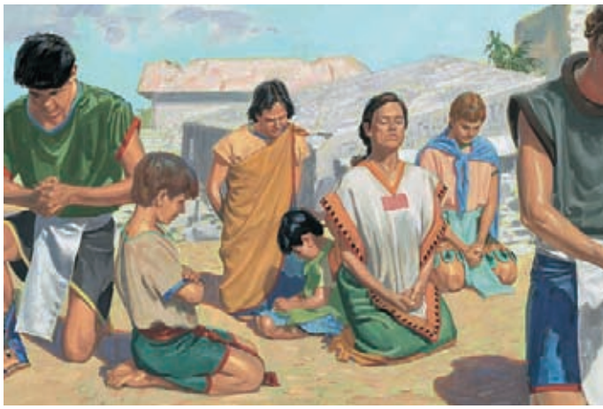
基督要所有的尼腓人跪在地上，並告訴祂的門徒開始禱告。 尼腓三書19：16-17