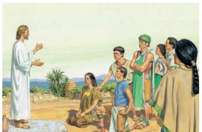
基督要人們停止禱告，但叫他們繼續在心中禱告。然後祂再度賜給他們聖餐。 尼腓三書20：1-5