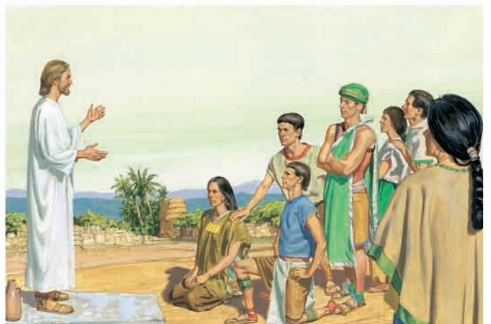
Cristo disse às pessoas que parassem de orar, mas que continuassem orando em seu coração. Em seguida, deu a elas o sacramento. 3 Néfi 20:1–5