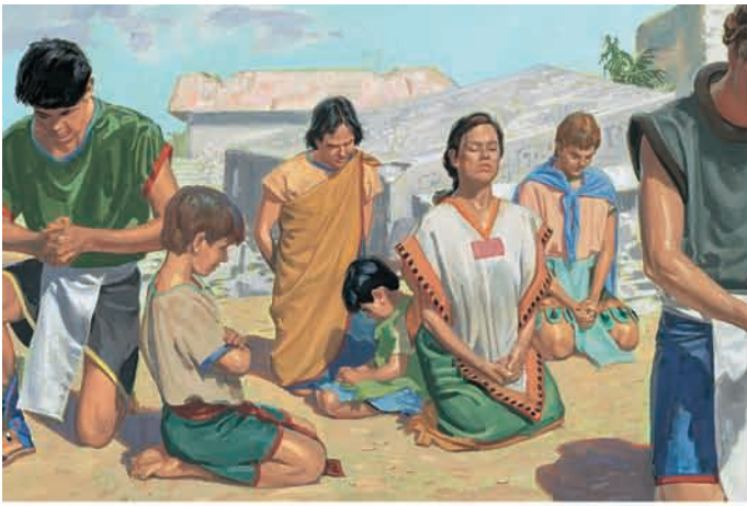
Cristo disse a todos os nefitas que se ajoelhassem. Pediu aos discípulos que orassem. 3 Néfi 19:16–17