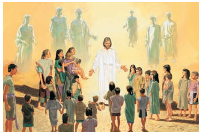
И когда люди смотрели на них, с Неба сошли Ангелы и окружили детей. Дети и Ангелы были окружены огнем. 3 Нефий 17:24