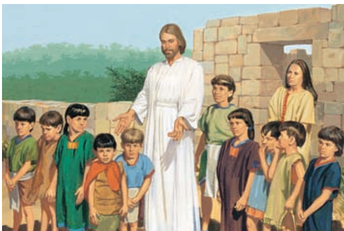
Иисус велел Нефийцам посмотреть на своих детей. 3 Нефий 17:23