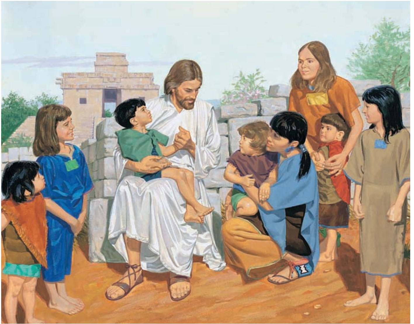
Dann nahm er die Kinder, eins nach dem anderen, und segnete sie. Er betete für sie zum Vater im Himmel, und er weinte wieder. 3 Nephi 17:21,22.