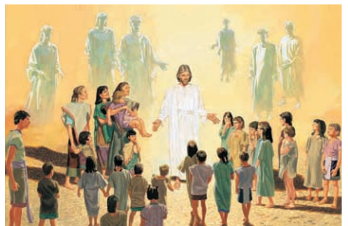
Als die Menschen hinschauten, kamen Engel vom Himmel herab und bildeten einen Kreis um die Kinder. Engel und Kinder waren wie von Feuer umschlossen. 3 Nephi 17:24.