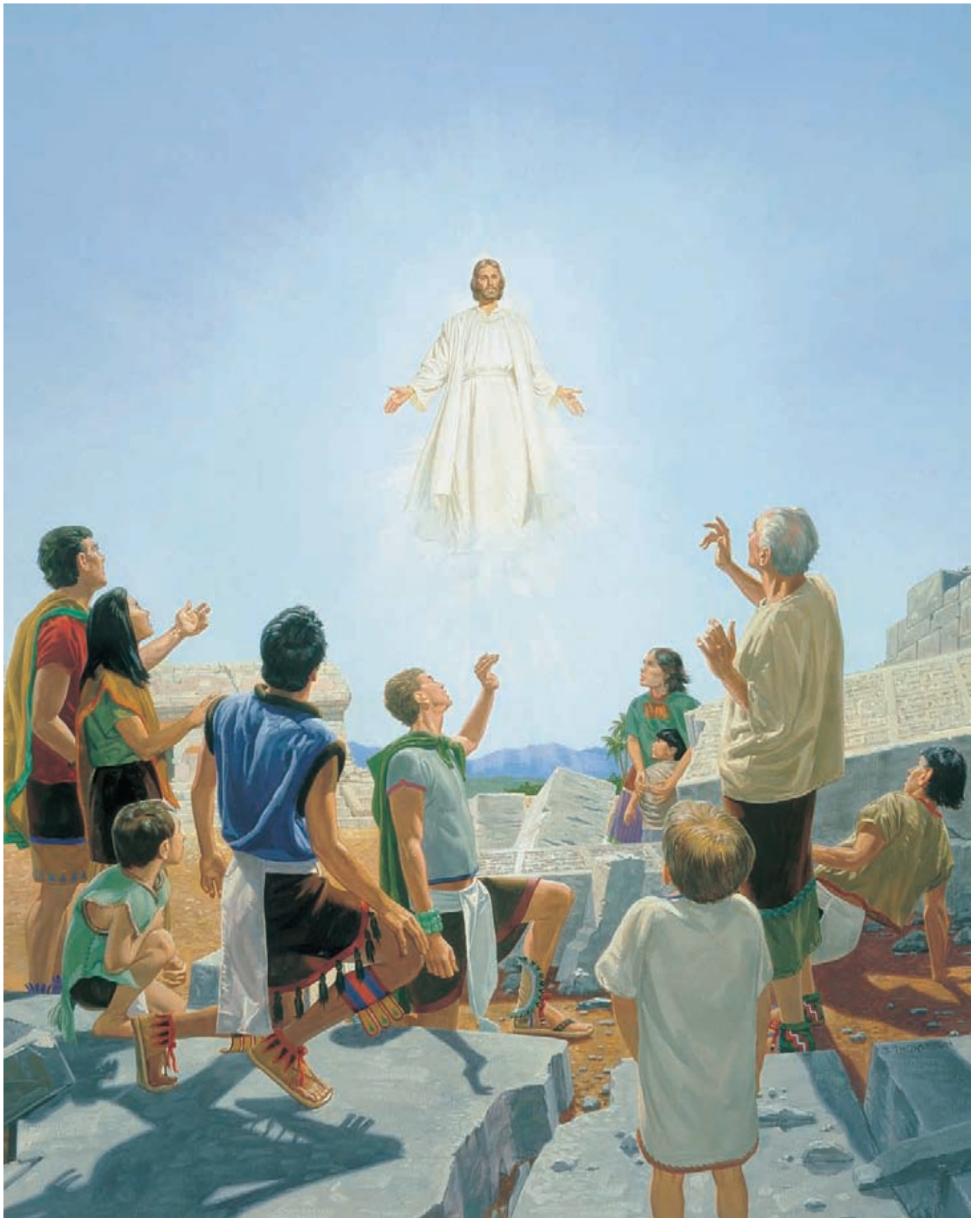
耶穌基督從天而降，站在人群當中。人們都不敢開口，因為他們不知道到底發生了什麼事，他們以為耶穌是天使。 尼腓三書11：8