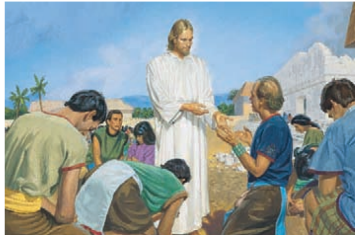
耶穌要人民上前摸一摸祂身體、手上及腳上被釘在十字架上時所留下的釘痕。 尼腓三書11：14