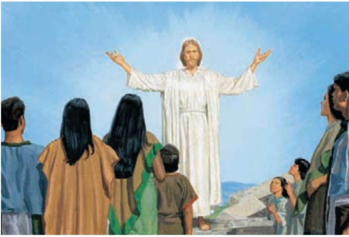
祂告訴他們，祂就是耶穌基督，就是先知們說要來的那位。 尼腓三書11：10