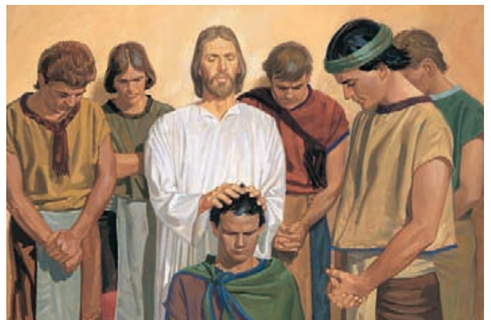
耶穌叫尼腓及其他十一個人上前，賜給他們聖職的權力，並教導他們正確的施洗方式。