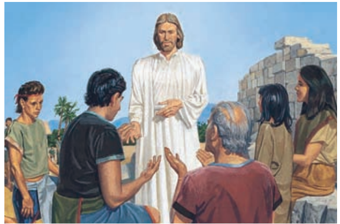
L'une après l'autre, les personnes touchent les marques dans le côté, les mains et les pieds de Jésus. Elles savent qu'il est le Sauveur.