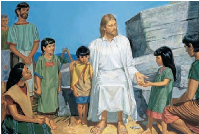
Jésus veut que les gens sachent qu'il est leur Dieu et qu'il est mort pour leurs péchés.