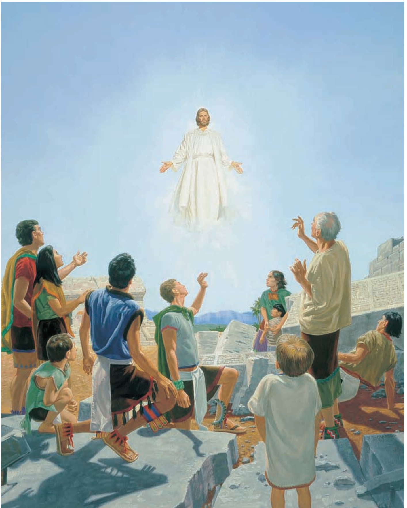
Jésus-Christ descend des cieux et se tient parmi eux. Ils ont peur de lui parler parce qu'ils ne comprennent pas ce qui se passe. Ils pensent que Jésus est un ange. 3 Néphï 11:8