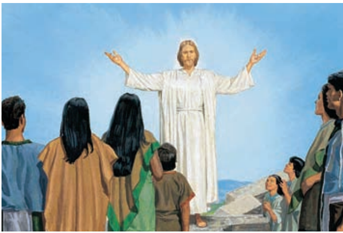
Il leur dit qu'il est Jésus-Christ, celui dont les prophètes ont dit qu'il viendrait.