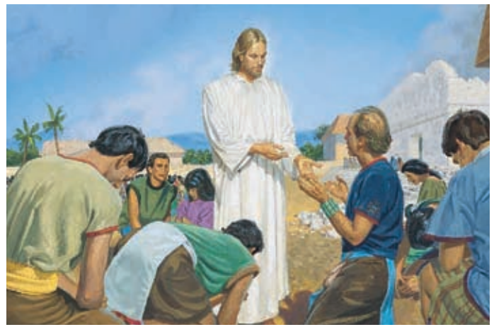
Jésus dit aux gens de venir et de toucher les marques dans son côté, dans ses mains et dans ses pieds, à l'endroit où se trouvaient les clous qui le tenaient à la croix.