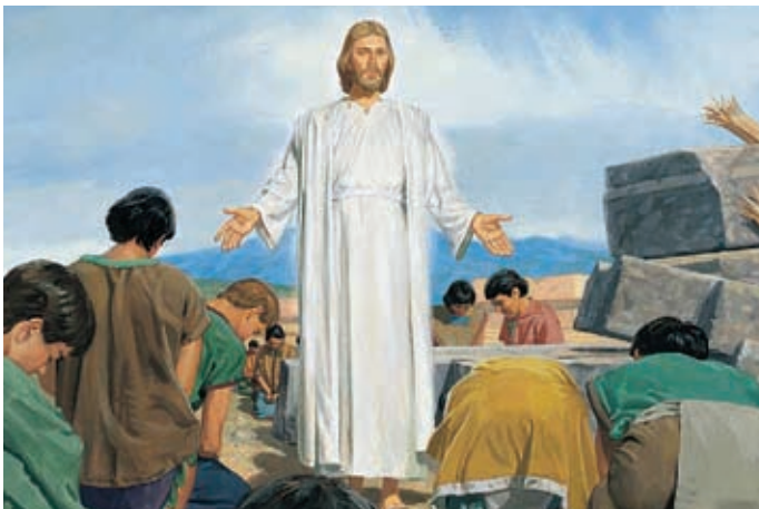
Puis le peuple loue Jésus, tombe à ses pieds et l'adore.