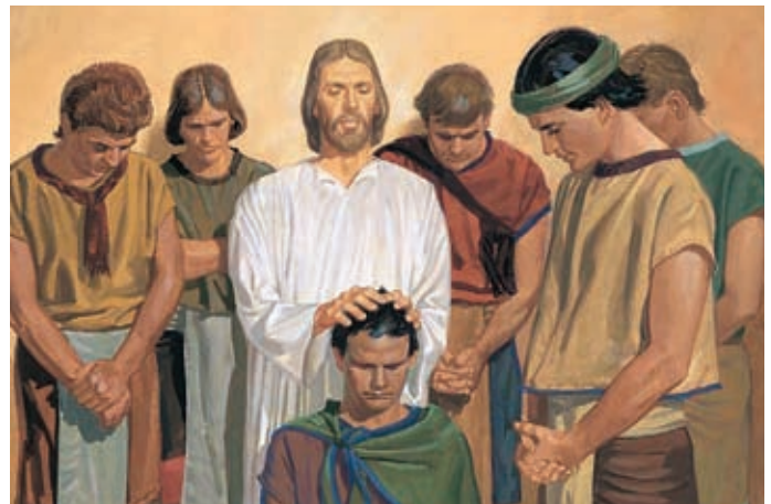
Jésus demande à Néphi et à onze autres hommes de venir. Il leur donne le pouvoir de la prêtrise et leur apprend comment baptiser.