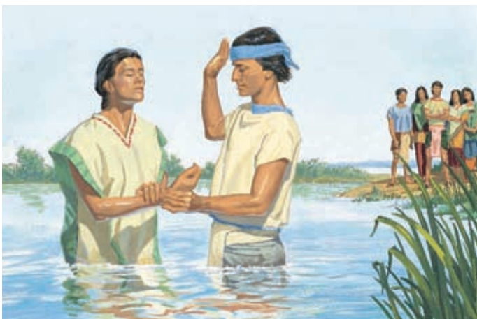
Néphi et d'autres dirigeants de l'Eglise baptisent tous ceux qui croient et qui se repentent. 3 Néphi 1:23