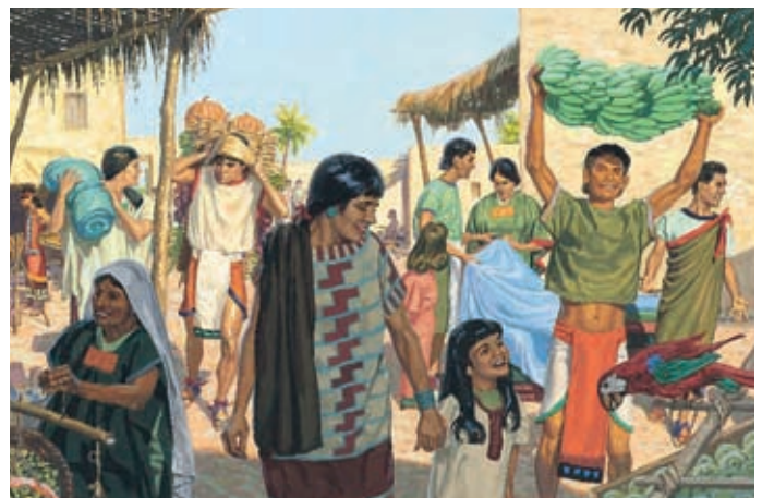
De joyeuses nouvelles circulent dans le pays parce que les paroles des prophètes se sont accomplies. Jésus-Christ est né. 3 Néphi 1:26