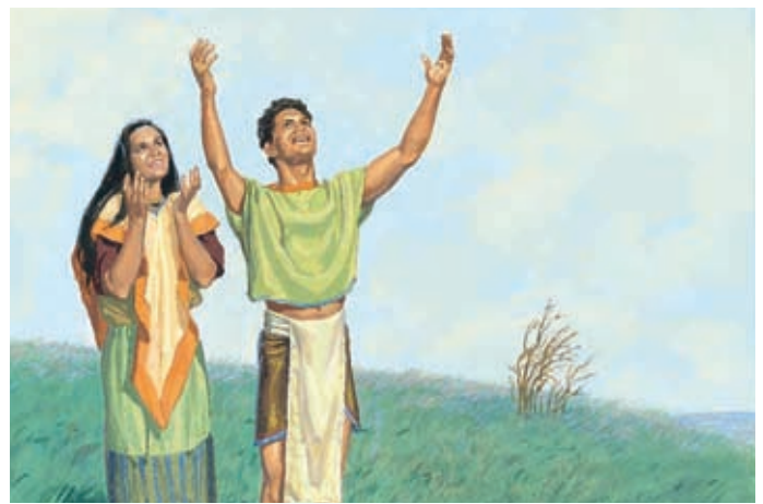
Satan essaie encore de pousser les gens à ne pas croire aux signes qu'ils ont vus, mais la plupart d'entre eux croient. 3 Néphi 1:22