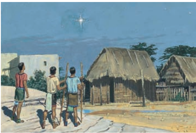
Une nouvelle étoile apparaît dans le ciel, comme les prophètes l'ont prédit. 3 Néphi 1:21