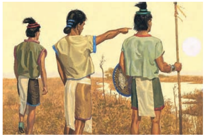
Il fait clair pendant toute la nuit. Le lendemain, au lever du soleil, les gens savent que Jésus-Christ naîtra ce jour-là. Les prophéties se sont accomplies. 3 Néphi 1:19-20