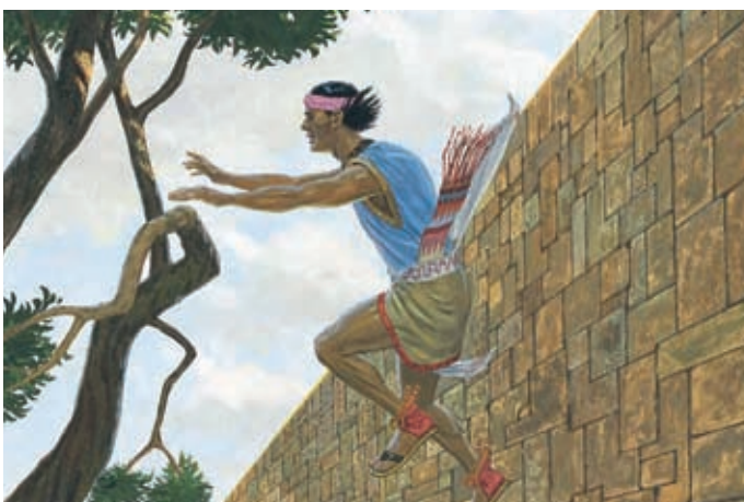
Samuel sprang von der Stadtmauer und floh in sein eigenes Land. Helaman 16:7.