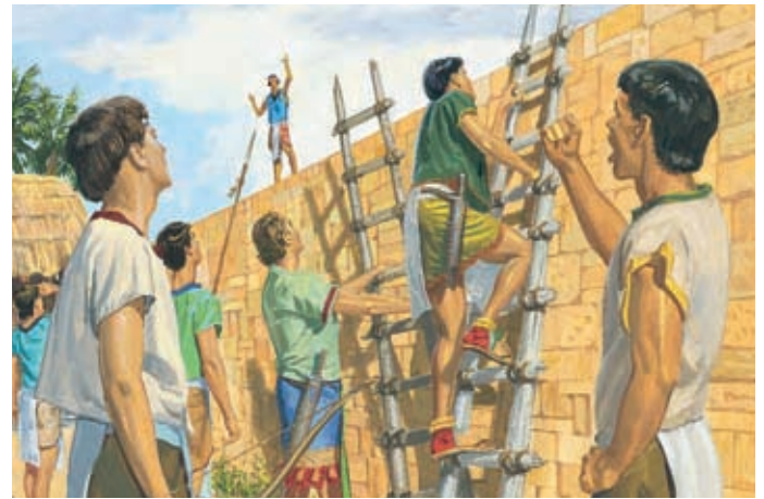
Die meisten Nephiten glaubten aber nicht, was Samuel sagte. Sie wollten ihn gefangennehmen. Helaman 16:6.