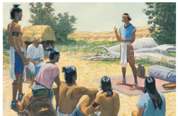
Samuel begann, die Lamaniten zu belehren. Bei den Nephiten hörte man nie mehr von ihm. Helaman 16:7,8.