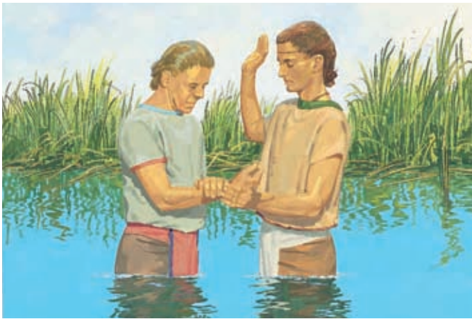
Nephi belehrte die Menschen ebenfalls über Jesus. Er wollte, daß sie an Jesus glaubten, umkehrten und sich taufen ließen. Helaman 16:4,5.