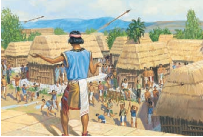
Die übrigen Nephiten glaubten Samuel nicht. Sie warfen Steine nach ihm und schossen mit Pfeilen auf ihn. Aber der Herr beschützte ihn, so daß die Steine und die Pfeile ihn nicht trafen. Helaman 16:2.