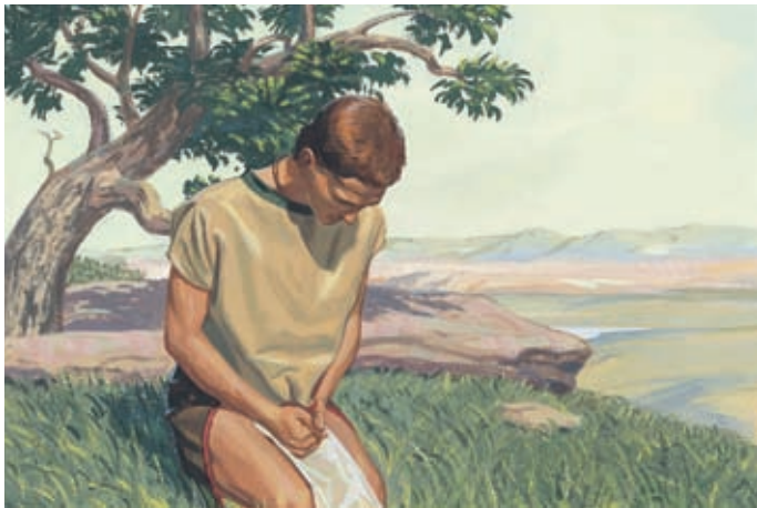
Нефий молился о голоде, надеясь, что недостаток еды смирит Нефийцев и поможет им покаяться. Геламан 11:3–4