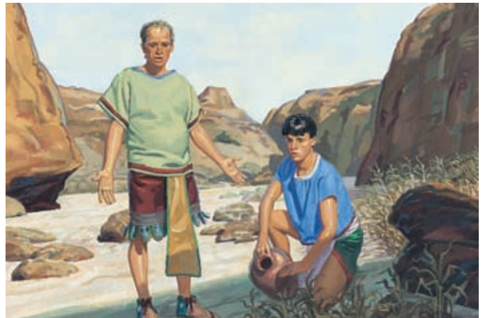
Наступил голод. Не было дождей, и поэтому земля высохла и зерно не могло вырасти. Люди перестали сражаться. Геламан 11:5–6