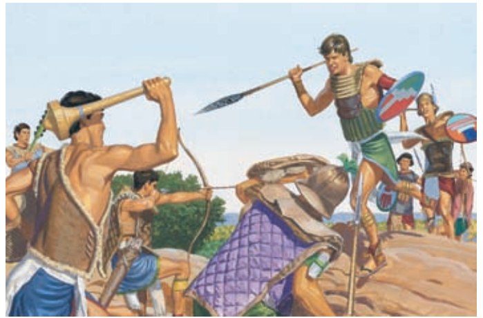
Но люди стали еще больше грешить и начали сражаться друг с другом. Геламан 11:1