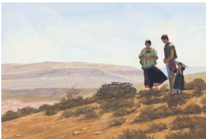
Нефийцы были голодны, и многие из них умерли. Выжившие стали вспоминать Господа и то, чему учил их Нефий. Геламан 11:6–7