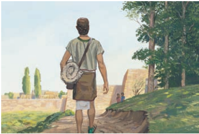
Нефий провозгласил слово Бога ко всем Нефийцам. Геламан 10:17