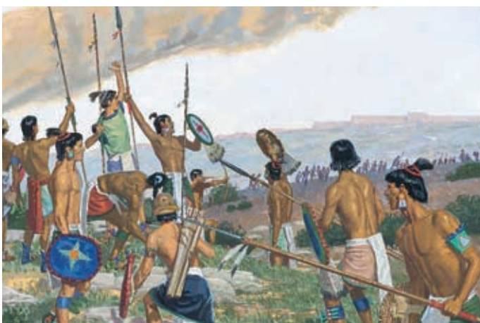
Die Nephiten versuchten, ihre Feinde, die Gadiantonräuber geworden waren, zu schlagen. Es gelang ihnen aber nicht, weil sie selbst wieder schlecht geworden waren. Helaman 11:26,28,29.