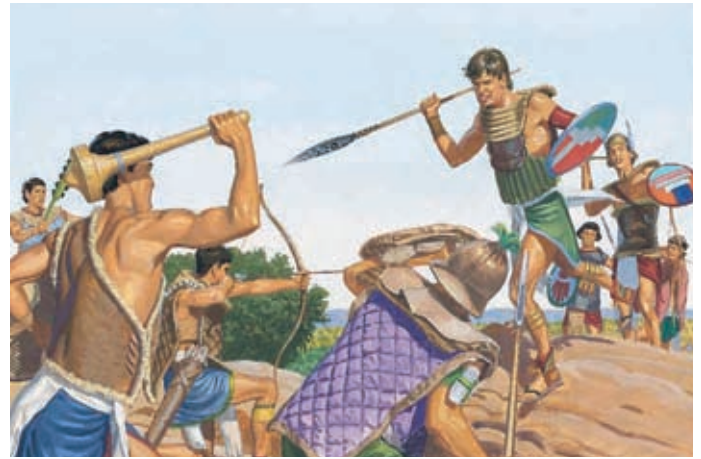
Aber das Volk wurde nur noch schlechter. Alle fingen an, miteinander zu kämpfen. Helaman 11:1