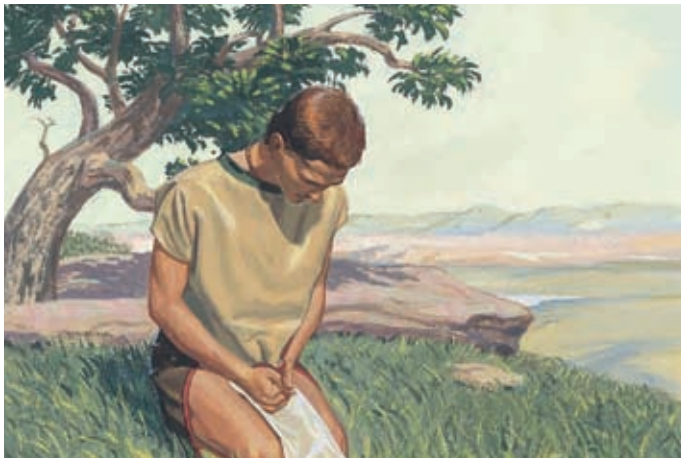
Da betete Nephi um eine Hungersnot, weil er hoffte, daß die Nephiten sich dann demütigten und umkehrten. Helaman 11:3,4.