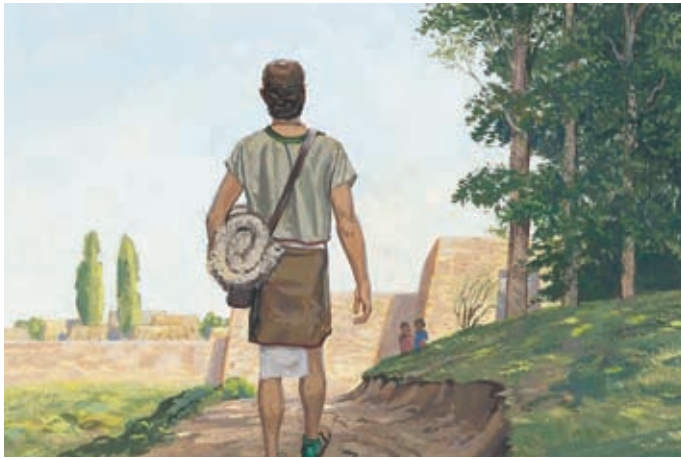
Nephi verkündete allen Nephiten das Wort Gottes. Helaman 10:17.