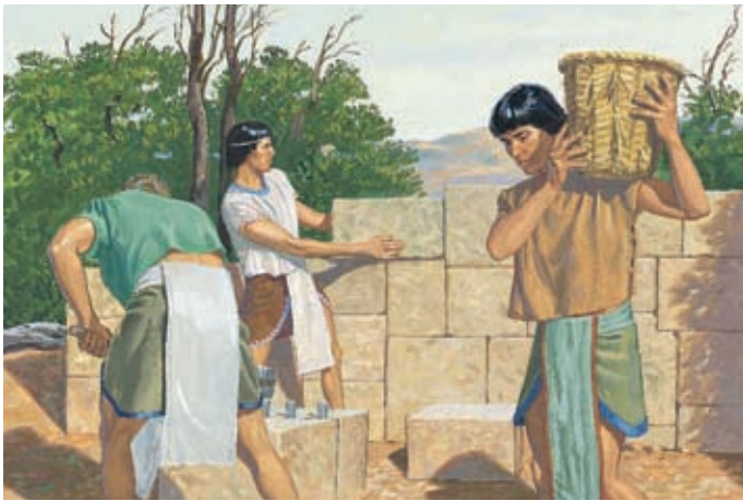
Die meisten Nephiten schlossen sich der Kirche an. Sie wurden reich, und ihre Städte wuchsen. Im ganzen Land herrschte Frieden. Helaman 11:20,21.