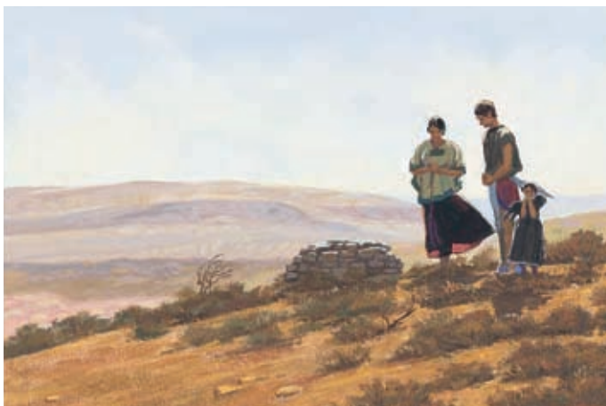
Die Nephiten hungerten, und viele starben. Diejenigen, die am Leben blieben, fingen an, sich an den Herrn zu erinnern und an das, was Nephi gesagt hatte. Helaman 11:6,7.