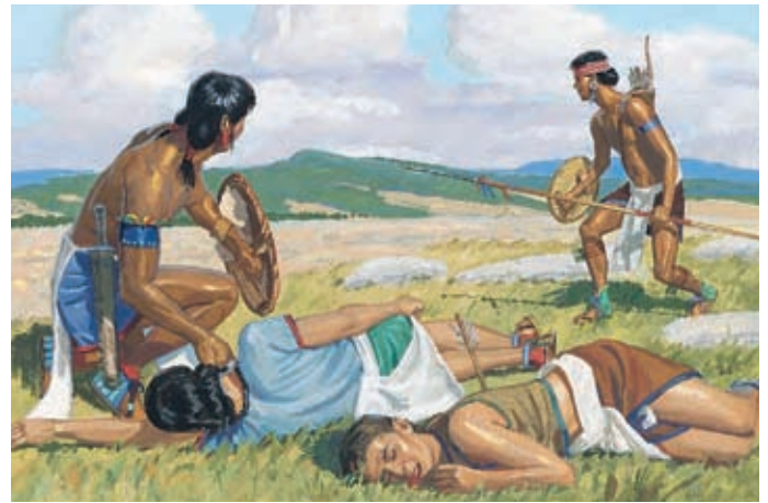
Aber dann griffen einige Nephiten, die sich früher den Lamaniten angeschlossen hatten, das nephitische Volk an. Helaman 11:24.