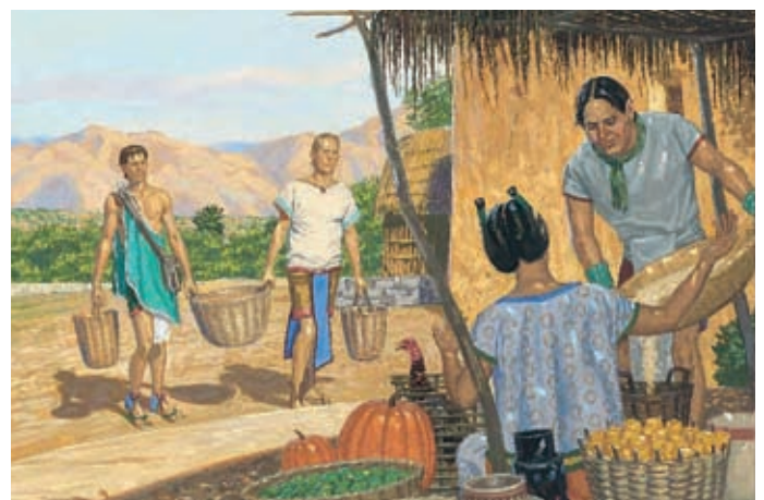
Solange die Nephiten rechtschaffen waren, segnete der Herr sie. Aber wenn sie stolz wurden und den Herrn vergaßen, schickte er ihnen Schwierigkeiten, damit sie sich wieder an ihn erinnerten. Helaman 12:1–3.