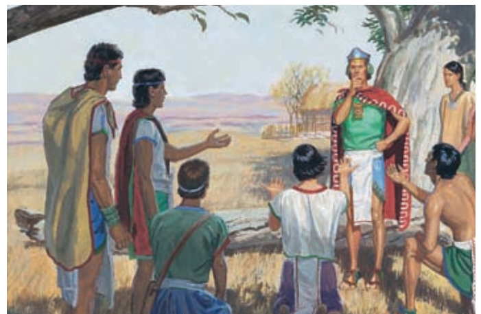
Das Volk kehrte von seinen Sünden um. Sie forderten ihre Richter auf, Nephi um ein Ende der Hungersnot zu bitten. Die Richter gingen zu Nephi. Helaman 11:8,9.