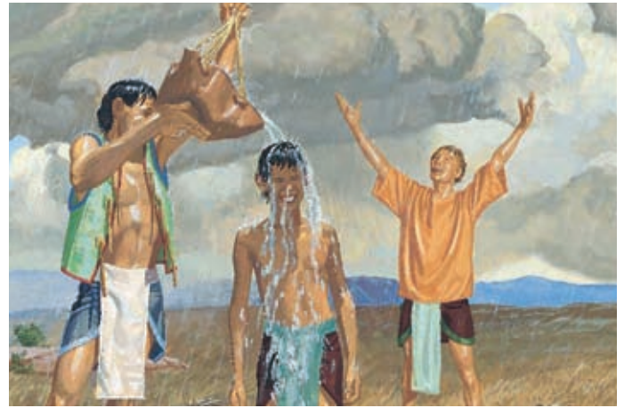
Der Herr erhörte Nephis Gebet, und es begann zu regnen. Bald wuchs alles wieder. Die Menschen priesen Gott und wußten, daß Nephi ein großer Prophet war. Helaman 11:17,18.