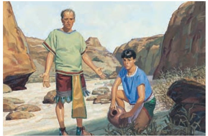
Die Hungersnot kam. Es fiel kein Regen, so daß die Erde austrocknete und nichts darauf wuchs. Da hörten die Nephiten auf, miteinander zu kämpfen. Helaman 11:5,6.