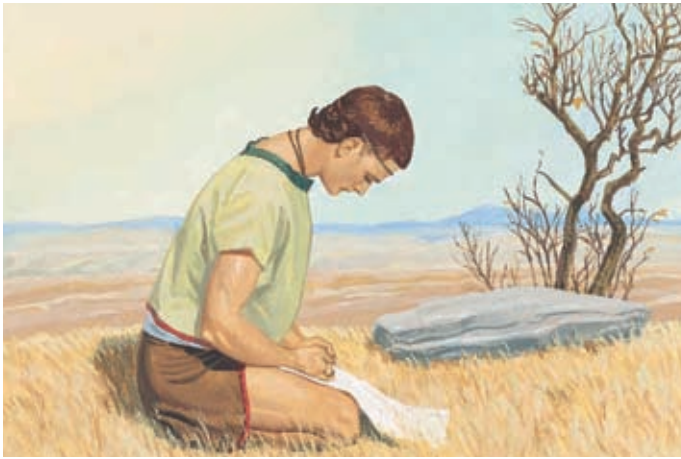
Als Nephi sah, daß die Menschen wirklich demütig geworden waren und umkehrten, bat er den Herrn, die Hungersnot zu beenden. Helaman 11:9–12.