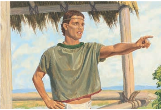
Néphi dit aux gens d'aller trouver le grand juge. Il sera étendu dans son sang, assassiné par un frère qui veut son poste. Hélamán 8:27