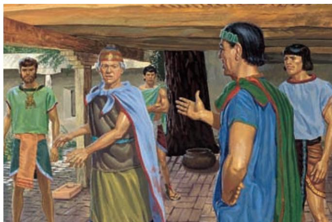
Néphi leur dit de demander à Séantum si Néphi et lui ont complété de tuer Seezoram. Néphi dit que Séantum dira non. Hélamán 9:27–28