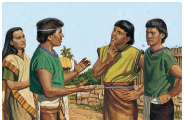
Ils jettent les cinq hommes en prison et annoncent dans toute la ville que le grand juge a été tué et que les meurtriers sont en prison. Hélamán 9:9