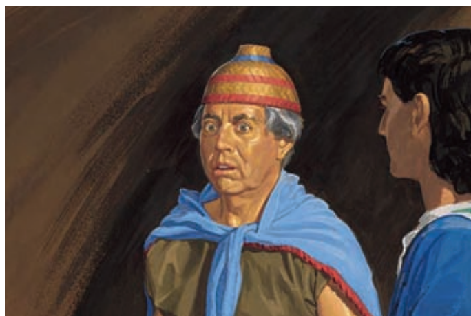
Néphi dit alors que Séantum tremblera et deviendra pâle et finira par confesser qu'il a tué son frère. Hélamán 9:33–35