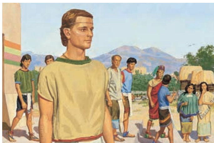
Lorsque le peuple quitte Néphi, certains disent qu'il est prophète, d'autres qu'il est un dieu. Néphi rentre chez lui, encore attristé par leur méchanceté. Hélamán 9:40–41; 10:2–3