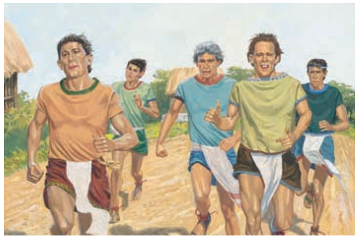
Cinq hommes de la foule se précipitent pour voir le grand juge. Ils ne croient pas que Néphi est prophète de Dieu. Hélamán 9:1-2