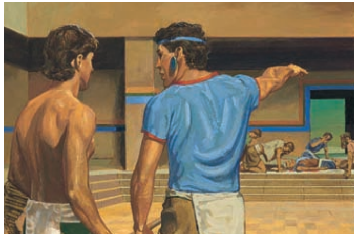
Les serviteurs de Seesoram avaient déjà trouvé le grand juge et avaient couru le dire au peuple. A leur retour, ils trouvent les cinq hommes étendus. Hélamán 9:6-7