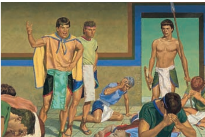
Les gens pensent que les cinq hommes ont assassiné Seesoram. Hélamán 9:8