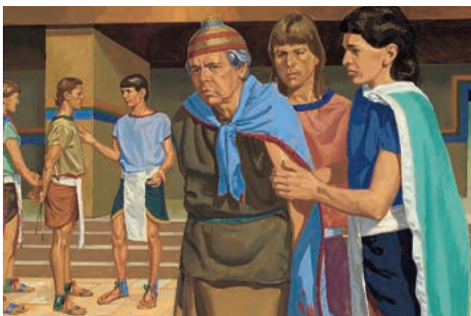
Les juges vont chez Séantum et tout se passe comme Néphi l'a dit. Néphi et les cinq hommes sont libérés. Hélamán 9:37–38