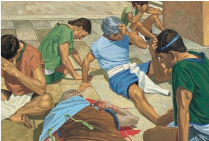
Lorsqu'ils voient Seesoram, le grand juge, étendu dans son sang, ils tombent de peur sur le sol. Ils savent maintenant que Néphi est un prophète. Hélamán 9:3-5