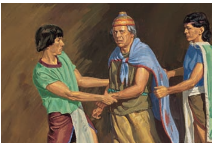
Les juges doivent alors demander à Séantum s'il a tué son frère. Séantum redira non, mais les juges trouveront du sang sur son vêtement. Hélamán 9:29–31