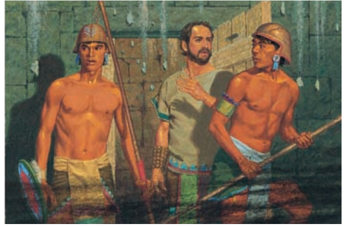
Die Erde und die Gefängnismauern bebten. Es wurde ganz dunkel im Gefängnis, und die Leute drinnen bekamen Angst. Helaman 5:27,28.