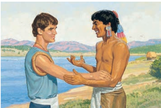
Die Lamaniten hörten auf, die Nephiten zu hassen, und gaben ihnen das Land zurück, das sie ihnen weggenommen hatten. Die Lamaniten wurden sogar noch rechtschaffener als die Nephiten. Helaman 5:50,52.