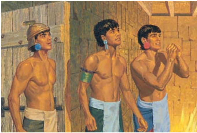
Eine Stimme flüsterte: „Friede, Friede sei mit euch wegen eures Glaubens an meinen Geliebten.“ Damit war Jesus Christus gemeint. Helaman 5:46,47.