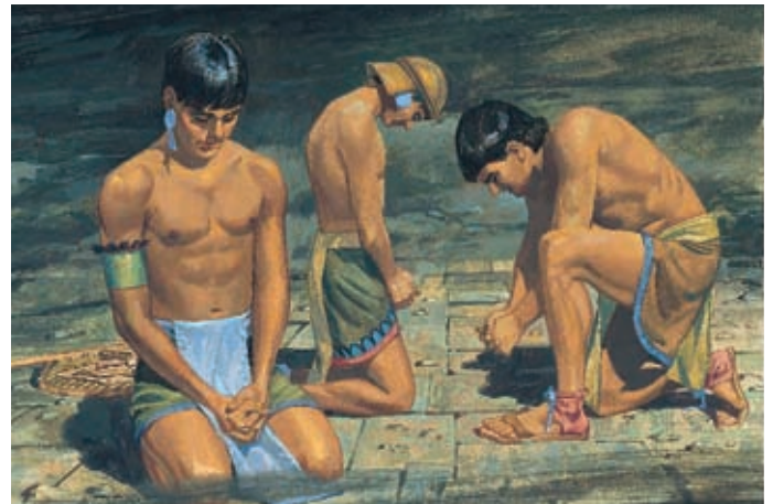
Die Lamaniten beteten, bis die Finsternis wich. Helaman 5:42.