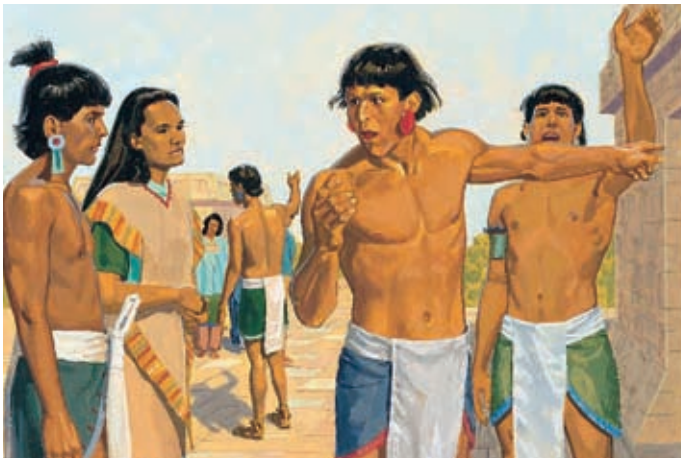
Ungefähr dreihundert Menschen sahen und hörten, was im Gefängnis geschah. Sie gingen und erzählten anderen davon. Helaman 5:49,50.