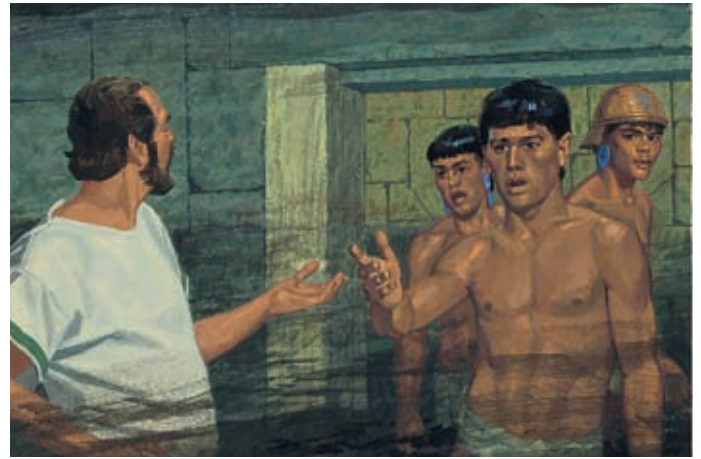
Der Mann, der Aminadab hieß, erklärte den Lamaniten, daß Nephi und Lehi mit Engeln sprachen. Helaman 5:39.