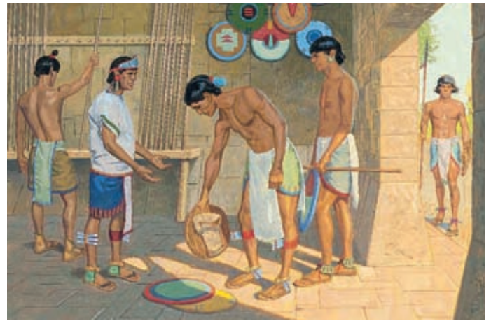
Die meisten Lamaniten glaubten ihnen und legten ihre Waffen fort. Helaman 5:50,51.