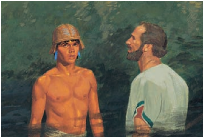
Da hörten sie durch die Dunkelheit eine Stimme. Sie war ganz leise, wie ein Flüstern, aber alle hörten sie. Helaman 5:29,30.