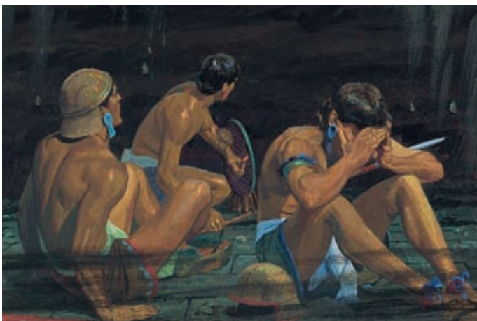
Dreimal ertönte die Stimme, und die Erde und die Mauern bebten weiterhin. Die Lamaniten konnten nicht davonlaufen, weil es zu finster war und sie zu viel Angst hatten. Helman 5:33,34.