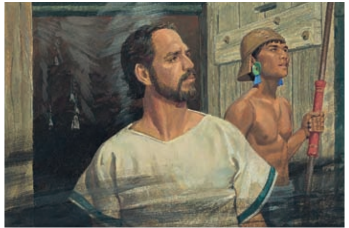
Die Stimme gebot den Leuten, umzukehren und Nephi und Lehi nicht zu töten. Helaman 5:29,30.