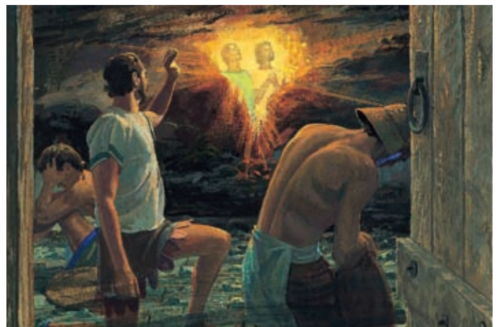
Ein Nephit, der früher zur Kirche gehört hatte, sah, daß das Gesicht Nephis und Lehis im Dunkeln leuchtete. Helaman 5:35,36.