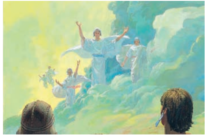
Die Lamaniten schauten nach oben, um zu sehen, woher die Stimme gekommen war. Da sahen sie Engel vom Himmel herabkommen. Helaman 5:48.