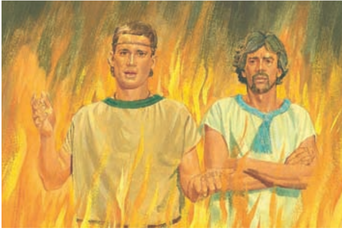
Nephi und Lehi verbrannten aber nicht. Sie erklärten den Lamaniten, daß Gott sie durch seine Macht beschütze. Helaman 5:24–26.