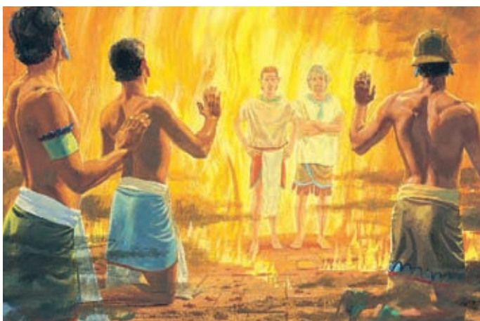
Als es wieder hell war, sahen die Menschen, daß sie ebenfalls von Feuer umgeben waren. Das Feuer verbrannte aber weder sie noch die Gefängnismauern. Helaman 5:43,44.