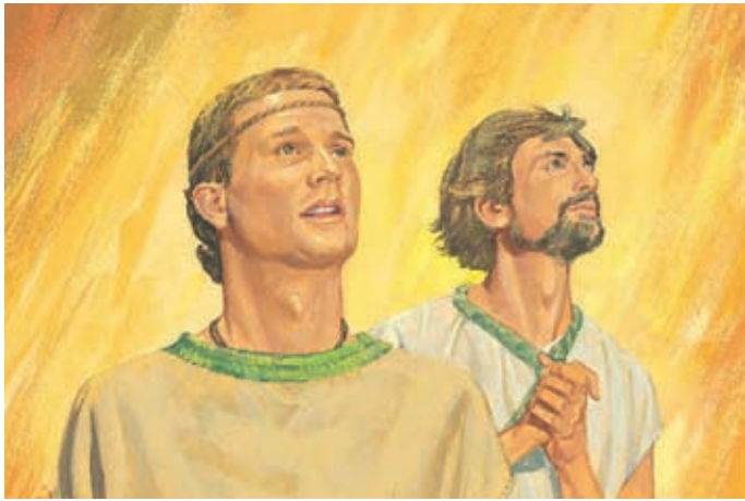
Nephi und Lehi blickten zum Himmel auf und redeten. Der Mann sagte den Lamaniten, sie sollten hinschauen. Sie fragten sich, mit wem Nephi und Lehi wohl sprachen. Helaman 5:36–38.