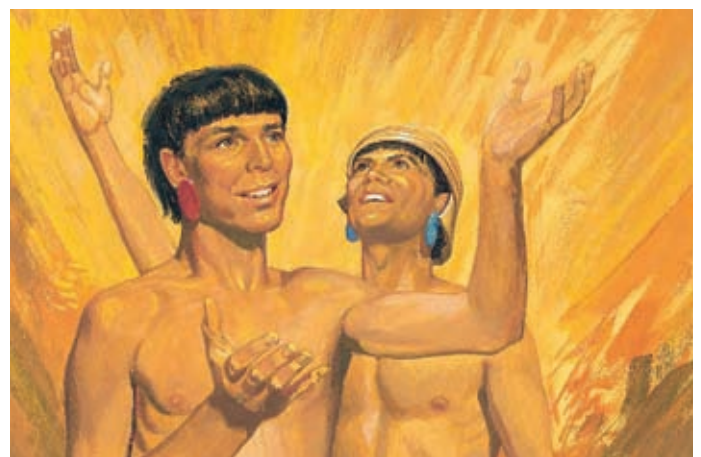
Da waren die Lamaniten sehr froh. Der Geist Gottes erfüllte ihr Herz. Helaman 5:44,45.