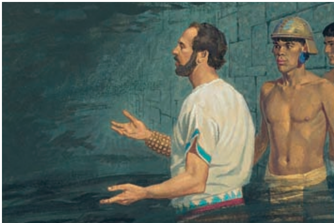
Die Lamaniten fragten Aminadab, was sie tun könnten, damit es wieder hell würde. Er antwortete, sie müßten von ihren Sünden umkehren und beten, bis sie Glauben an Jesus Christus hätten. Helaman 5:40,41.