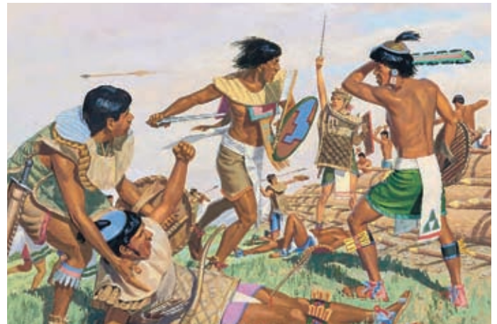
Helaman und seine Krieger kämpften in mehreren Schlachten gegen die Lamaniten. Die jungen Männer gehorchten allen Befehlen Helamans. Alma 57:19–21.