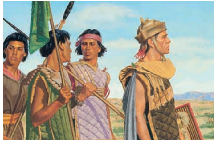
Helaman führte seine zweitausend jungen Krieger in die Schlacht. Er nannte sie seine Söhne, und sie nannten ihn Vater. Alma 53:22; 56:46.