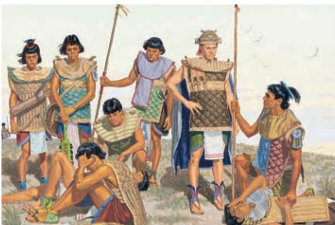
Sie kämpften tapfer und halfen, den Feind in die Flucht zu schlagen. Nach der Schlacht stellte Helaman fest, daß alle seine Söhne verwundet waren, aber nicht ein einziger war getötet. Alma 57:22,25.