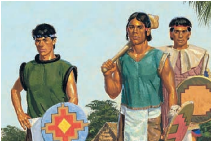
Diese jungen Männer waren tapfer, mutig und stark. Sie waren aber auch ehrlich und zuverlässig und befolgten Gottes Gebote. Alma 53:20,21.