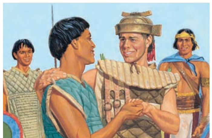
Das war ein richtiges Wunder. Helaman war darüber sehr froh. Er wußte, daß diese jungen Männer geschützt worden waren, weil sie so großen Glauben an Gott hatten. Alma 57:26,27.