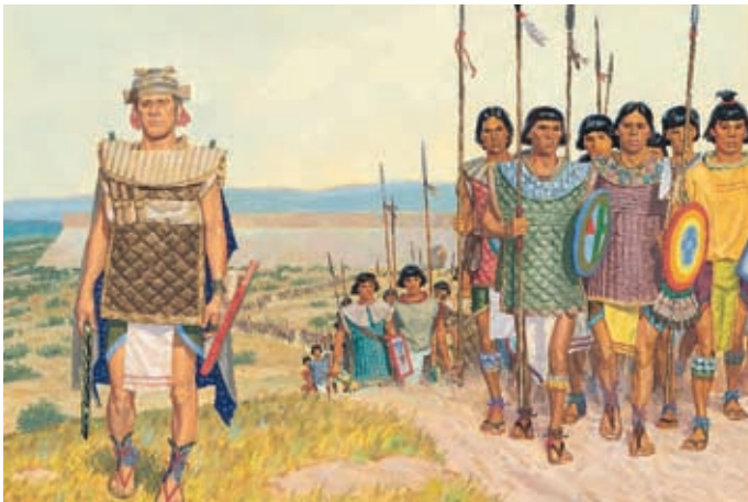
Obwohl die Söhne Helamans noch nie zuvor gekämpft hatten, fürchteten sie sich nicht. Ihre Mütter hatten sie nämlich gelehrt, daß Gott ihnen helfen werde, wenn sie an ihn glaubten. Alma 56:47.