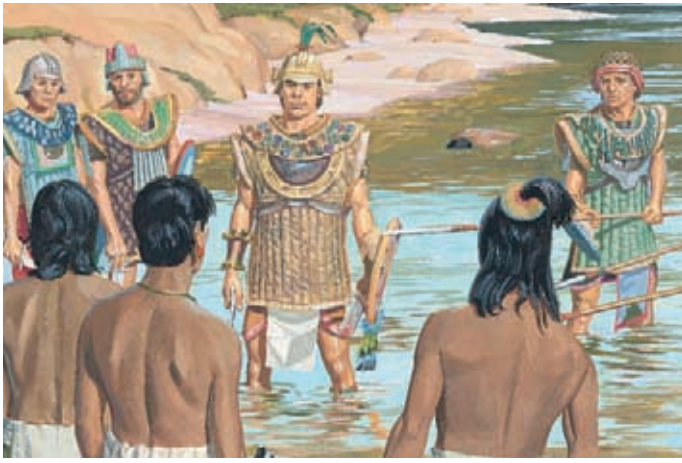
主賜力量給尼腓軍隊，他們將拉曼人包圍起來，摩羅乃命令他們停戰。 阿爾瑪書43：50，52-54