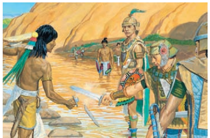
這時，柴雷罕納衝上前去想殺摩羅乃，但有個尼腓士兵先把他的劍砍斷了。 阿爾瑪書44：12