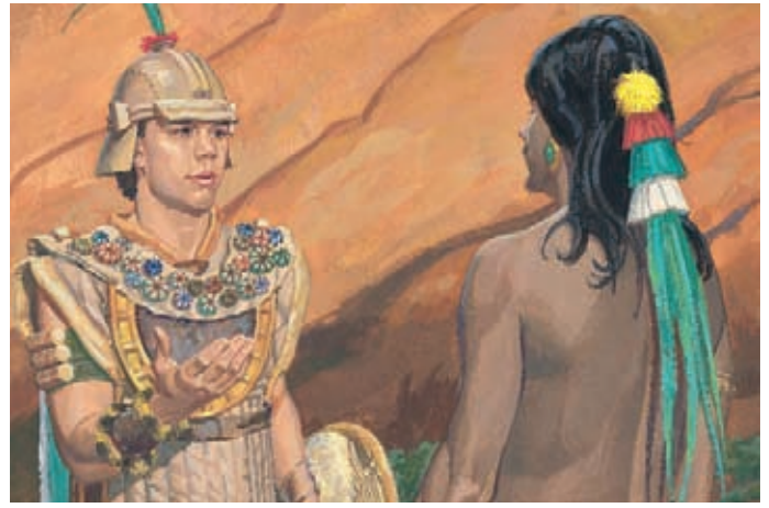
摩羅乃告訴柴雷罕納，尼腓人不想殺害他們，也不想把他們當作奴隸。 阿爾瑪書44：1-3