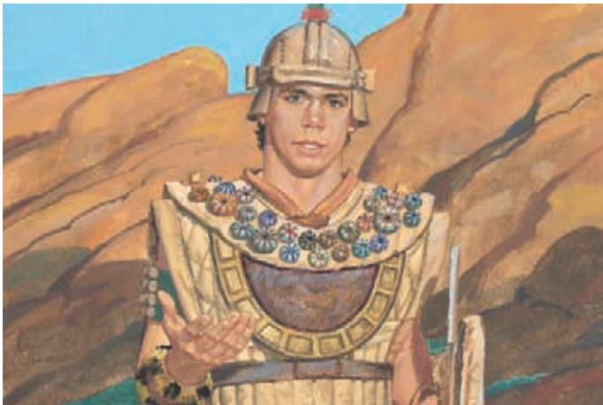
他說拉曼人並不能摧毀尼腓人對耶穌基督的信心，而且，只要尼腓人保持忠信，神一定會繼續幫助他們作戰。 阿爾瑪書44：4