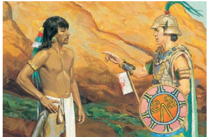
摩羅乃命令柴雷罕納放下武器。他說，只要拉曼人答應不再打尼腓人，他們就不會被殺死。 阿爾瑪書44：5-6