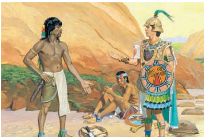
柴雷罕納將武器交給摩羅乃，但不答應不打仗，摩羅乃於是把武器還給他們，這樣拉曼人才能保護自己。 阿爾瑪書44：8，10