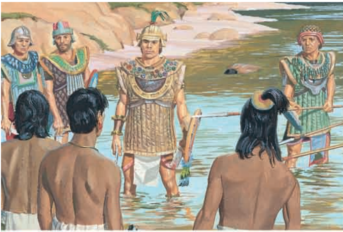
O Senhor fortaleceu o exército dos nefitas. O exército cercou os lamanitas, e Morôni ordenou que parassem de lutar. Alma 43:50, 52-54