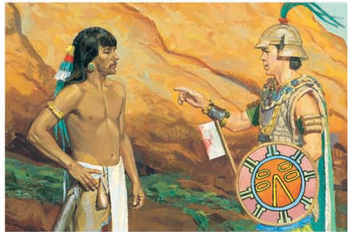
Morôni ordenou a Zeraemna que entregasse suas armas. Os lamanitas não seriam mortos se prometessem nunca mais lutar contra os nefitas. Alma 44:5-6