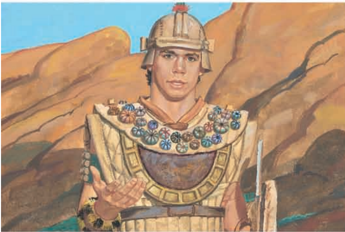
Morôni disse que os lamanitas não conseguiriam destruir a fé dos nefitas em Jesus Cristo. Ele disse que Deus continuaria a ajudar os nefitas enquanto eles tivessem fé. Alma 44:4