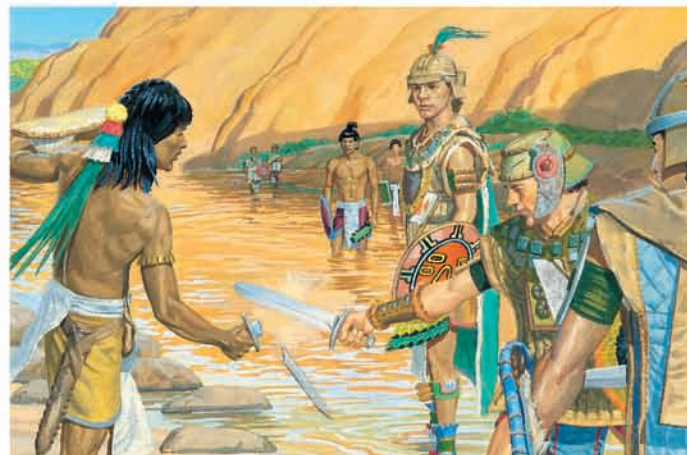
Zeraemna avançou sobre Morôni para matá-lo, mas um soldado nefita quebrou a espada de Zeraemna. Alma 44:12