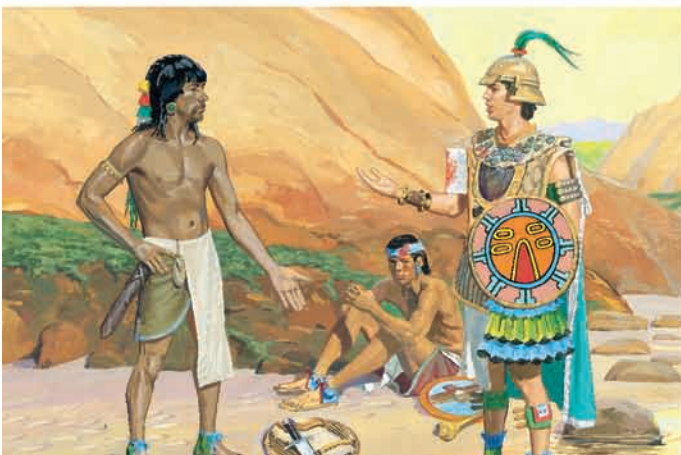
Zeraemna entregou as armas a Morôni, mas não prometeu nunca mais lutar. Morôni devolveu as armas aos lamanitas para que eles se defendessem. Alma 44:8, 10