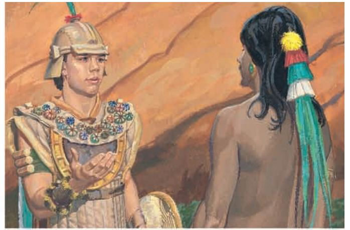
Morôni disse a Zeraemna que os nefitas não queriam matar ou escravizar os lamanitas. Alma 44:1-3