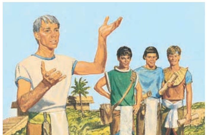
Alma et ses fils continuent d'enseigner l'Évangile. Ils enseignent par le pouvoir de la prêtrise. Alma 43:1-2