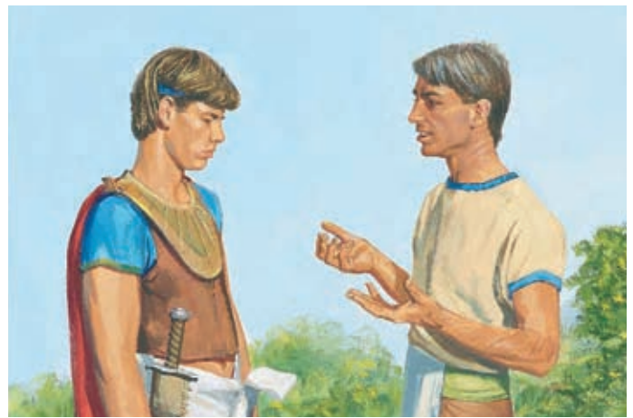
Alma dit à Corianton que les gens ne peuvent pas cacher leurs péchés à Dieu et que Corianton doit se repentir. Alma 39:8-9