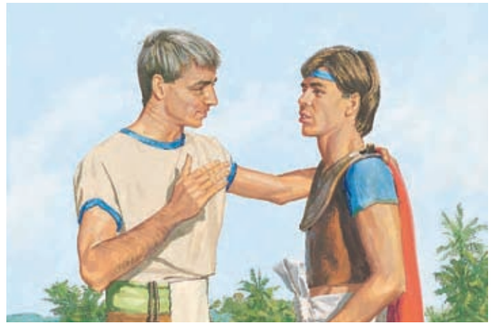
Cette vie est le moment pour que les gens se repentent et servent Dieu, dit Alma. Alma 42:4