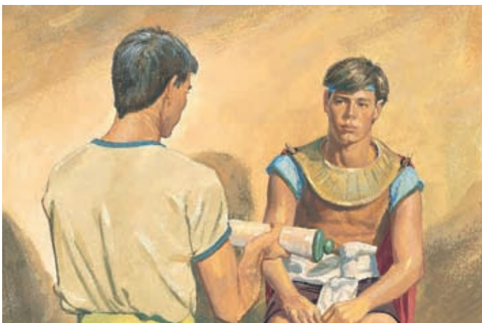
Rappelant à Corianton qu'il a été appelé à être missionnaire, Alma lui dit de retourner auprès des Zoramites et d'enseigner le repentir aux gens. Alma 42:31