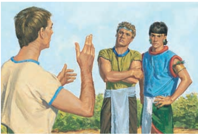
A cause des actions de Corianton, les Zoramites n'ont pas voulu croire aux enseignements d'Alma. Alma 39:11