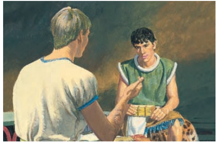
Alma versprach Helaman, Gott werde ihn segnen und ihm helfen, die Berichte zu schützen, wenn er die Gebote befolgte. Alma 37:13,16.