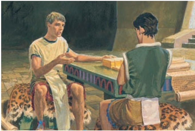
Alma übergab Helaman die heiligen Berichte und trug ihm auf, die Geschichte ihres Volkes fortzuführen. Alma 37:1,2.