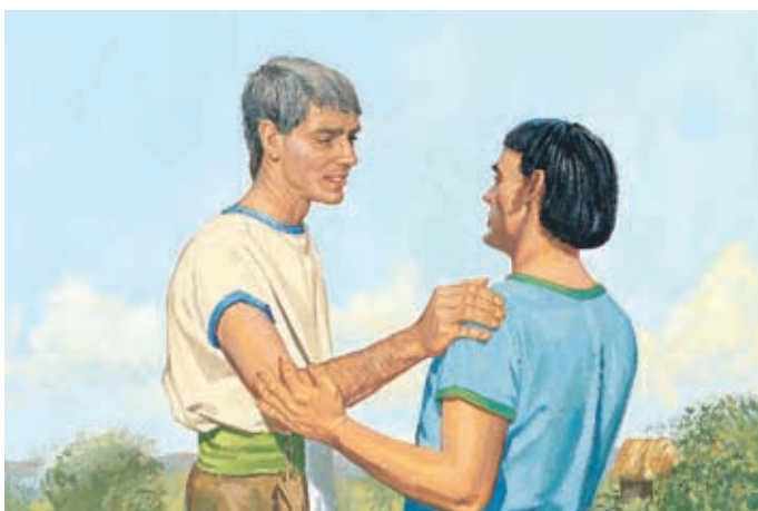
Alma erinnerte Shiblon noch einmal daran, daß wir nur durch Jesus Christus errettet werden können, und auf keine andere Weise. Dann forderte er ihn auf, auch weiterhin das Evangelium zu lehren. Alma 38:9,10.