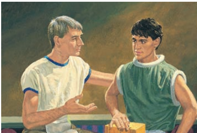
Alma forderte Helaman auch auf, jeden Morgen und jeden Abend zu beten und mit Gott alles zu besprechen, was er tat, damit Gott ihn führen konnte. Alma 37:36,37.