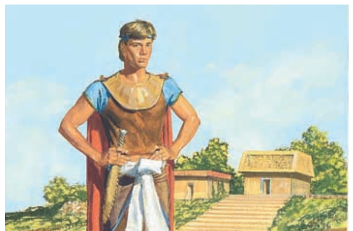
Almas Sohn Korianton hatte die Gebote nicht befolgt. Er war bei den Zoramiten kein gläubiger und treuer Missionar gewesen. Alma 39:2,3.