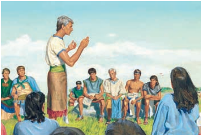
Molti venivano a chiedere ad Alma cosa dovevano fare. Alma diceva loro che non era necessario che entrassero in una chiesa per pregare o adorare Dio. Alma 32:5, 10-11