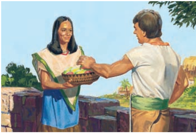
I missionari andarono a predicare in direzioni diverse. Dio dava loro cibo e vesti e li sosteneva nel loro lavoro. Alma 31:37-38