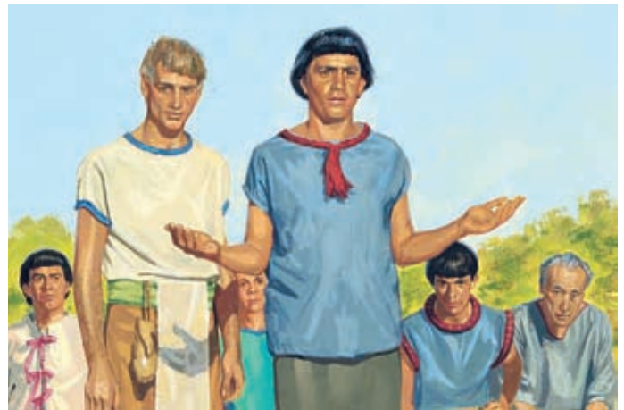
Egli insegnò loro ad avere fede in Dio. Poi Amulek parlò loro di Gesù Cristo e del piano di Dio per i Suoi figli. Alma 32:17-21; 34:8-9