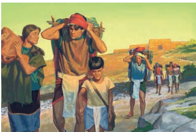
I missionari partirono e gli Zoramiti che avevano creduto loro furono scacciati dalla città. I credenti andarono a vivere nel paese di Gershon insieme al popolo di Ammon. Alma 35:1-2, 6