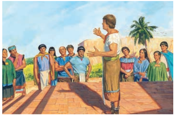
Agli Zoramiti poveri non era consentito entrare nelle chiese. Queste persone cominciarono ad ascoltare i missionari. Alma 32:2-3