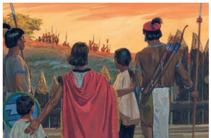
Anche se gli Zoramiti malvagi minacciavano il popolo di Ammon, questo popolo aiutò gli Zoramiti giusti dando loro cibo, vesti e terre. Alma 35:8-9