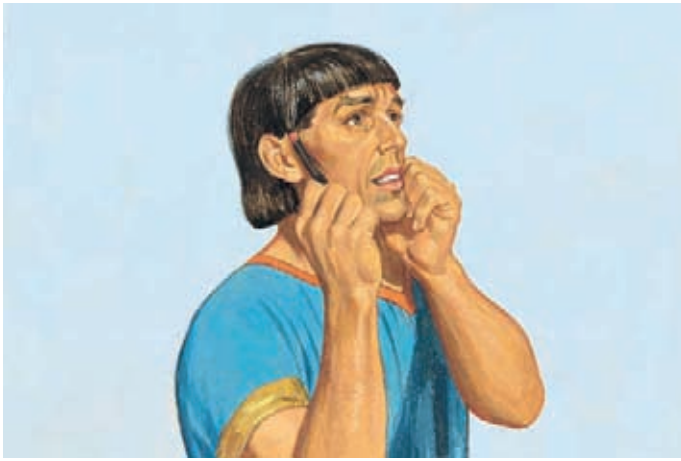
阿爾瑪剛說完這句話，柯力何就不能發出聲音說話了。 阿爾瑪書30：50