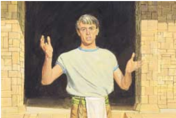
엘마는 코리호어가 말하게 되면 사람들에게 다시 거짓말을 하리라는 것을 알았습니다. 그래서 엘마는 코리호어가 다시 말할 수 있느냐 하는 문제는 주님께서 결정하실 것이라고 말했습니다. 엘마서 30:55