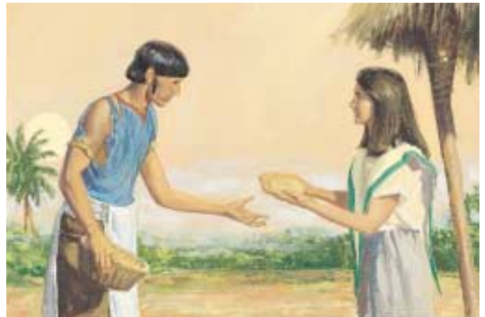
주님께서는 코리호어에게 말할 수 있는 능력을 되돌려 주시지 않았습니다. 코리호어는 집집마다 돌아다니며 음식을 구걸해야 했습니다. 엘마서 30:56