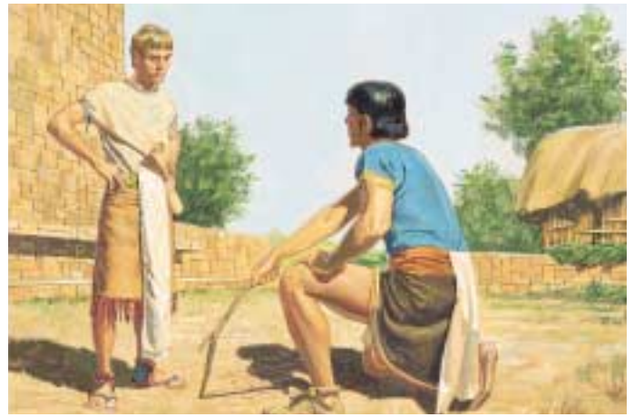
코리호어가 손을 내밀어 쓰기를 이 표적은 하나님께서 내리신 것이며 그는 언제나 하나님께서 살아 계시다는 것을 알고 있었다고 했습니다. 그는 엘마에게 기도하여 저주를 풀어 달라고 간청했습니다. 엘마서 30:52, 54