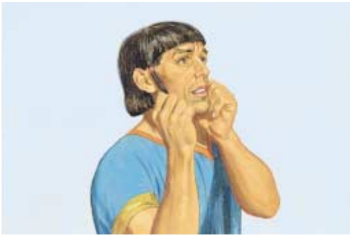
엘마가 이 말을 마치자 코리호어는 말을 할 수 없게 되었습니다. 엘마서 30:50