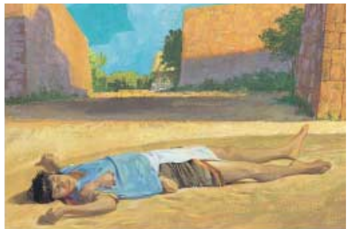
코리호어는 조람인들과 살려고 그들에게 갔습니다. 어느 날 그가 구걸을 하자 조람인들은 그를 짓밟아 죽이고 말았습니다. 엘마서 30:59