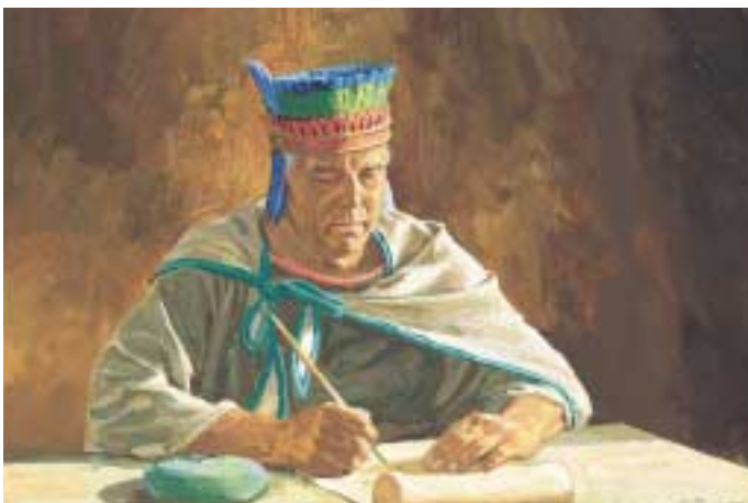
대판사는 방방곡곡에 코리호어에게 일어났던 일에 대해 포고문을 보냈습니다. 그는 코리호어를 믿었던 자들은 회개하라고 말했습니다. 백성들은 회개했습니다. 엘마서 30:57~58