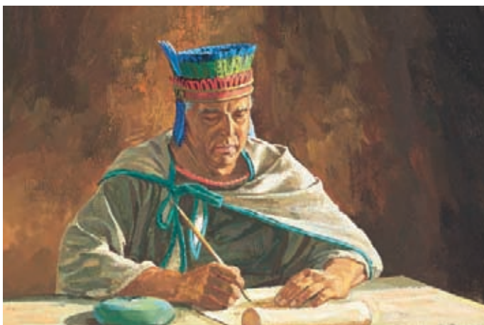
首席法官向全體人民發布公告，說明發生在柯力何身上的事。他要那些相信柯力何的人悔改，人們都悔改了。 阿爾瑪書30：57-58