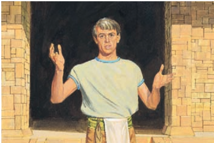
阿爾瑪知道如果柯力何可以說話，他就會再去欺騙人民。於是阿爾瑪說，主會決定柯力何能不能再說話。 阿爾瑪書30：55