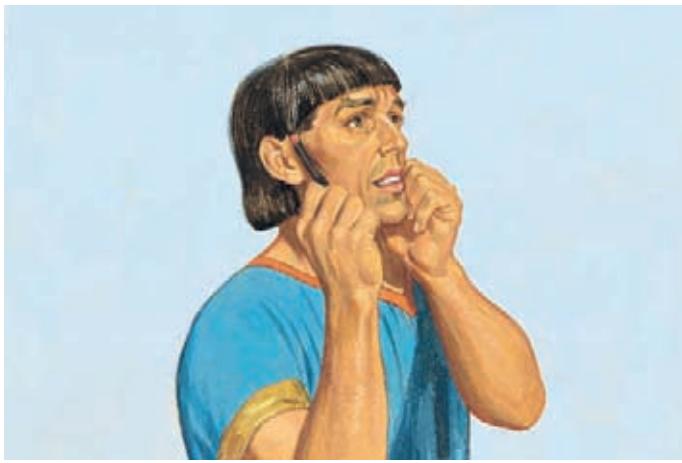
阿爾瑪剛說完這句話，柯力何就不能發出聲音說話了。 阿爾瑪書30：50