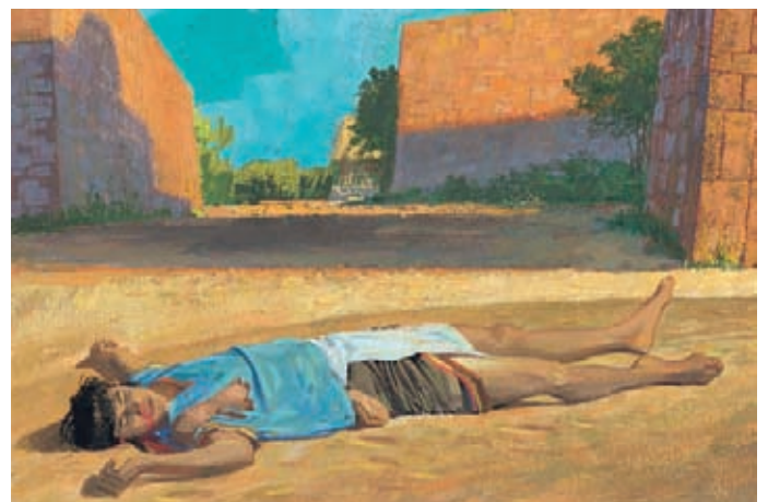
柯力何後來去跟卓倫人住在一起，有一天他在乞討食物時，被人踩死了。 阿爾瑪書30：59