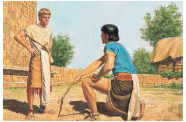
柯力何寫道，他知道這就是來自神的神蹟，而且他早就知道有一位神了。他懇求阿爾瑪爲他祈禱，免去這個詛罰。 阿爾瑪書30：52，54