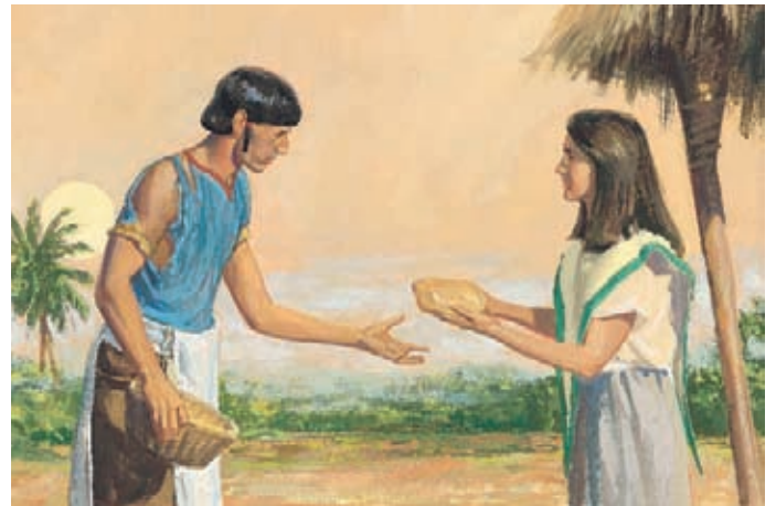
主並沒有恢復柯力何說話的能力，柯力何只好挨家挨戶地乞討食物。 阿爾瑪書30：56