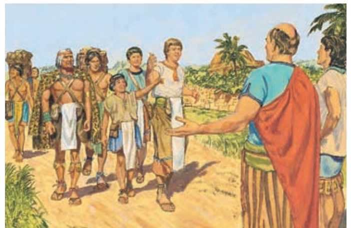
Die Nephiten in Zarahemla gaben Ammon und seinem Volk das Land Jerschon und beschützten sie dort. Sie wurden gute Freunde. Alma 27:22,23.