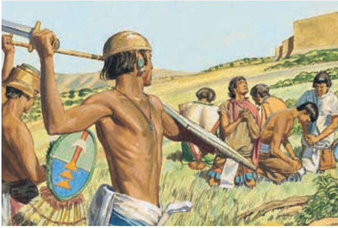
Als die schlechten Lamaniten kamen und den Kampf begannen, warf sich das Volk Ammon zur Erde nieder und betete. Alma 24:21.