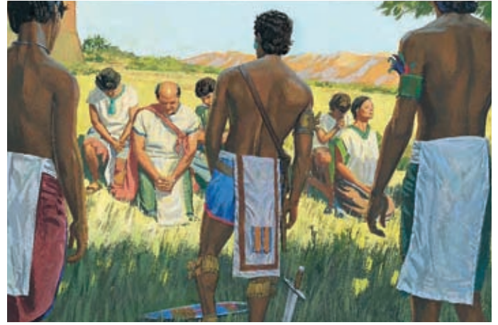
Als die schlechten Lamaniten sahen, daß das Volk Ammon sich nicht wehrte, hörten viele von ihnen auf zu kämpfen. Alma 24:23,24.