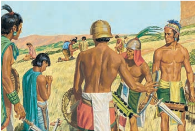
Den Lamaniten tat es leid, daß sie getötet hatten. Sie warfen ihre Waffen weg und schlossen sich dem Volk Ammon an. Sie wollten auch nicht mehr kämpfen. Alma 24:24–27.