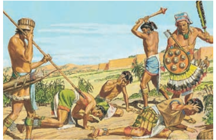
Dann kamen noch mehr Lamaniten, um das Volk Ammon zu töten. Viele vom Volk wurden getötet, weil sie nicht kämpfen wollten. Alma 27:2,3.