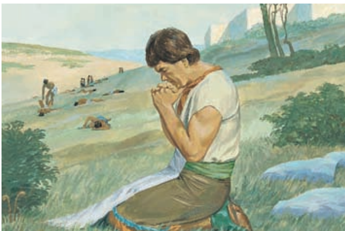
Ammon wollte nicht, daß das Volk, das er liebte, vernichtet wurde. Darum betete er um Hilfe. Der Herr gebot ihm, mit dem ganzen Volk das Land zu verlassen. Alma 27:4,5,10–12.