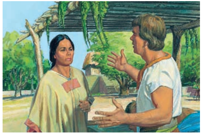
Ammon sapeva che Lamoni era sotto il potere di Dio. Disse alla regina che Lamoni si sarebbe ridestato il giorno dopo. Alma 19:6–8