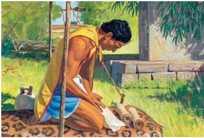
Re Lamoni credette ad Ammon e pregò per essere perdonato dei suoi peccati. Quindi cadde a terra come morto. Alma 18:40–42