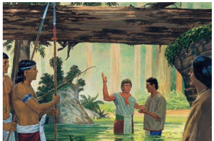
Lamoni parlò al suo popolo di Dio e di Gesù Cristo. Coloro che credettero si pentirono dei loro peccati e furono battezzati. Alma 19:31, 35