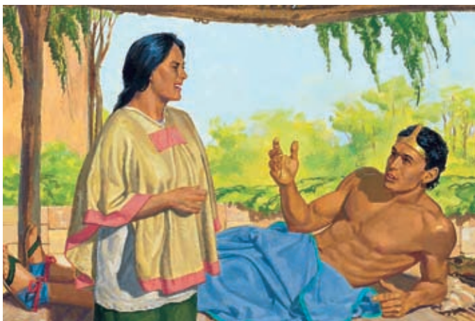
La donna rimase accanto al letto di Lamoni per tutta la notte. Il giorno dopo Lamoni si alzò e disse di aver veduto Gesù Cristo. Il re e la regina furono riempiti dello Spirito Santo. Alma 19:11–13