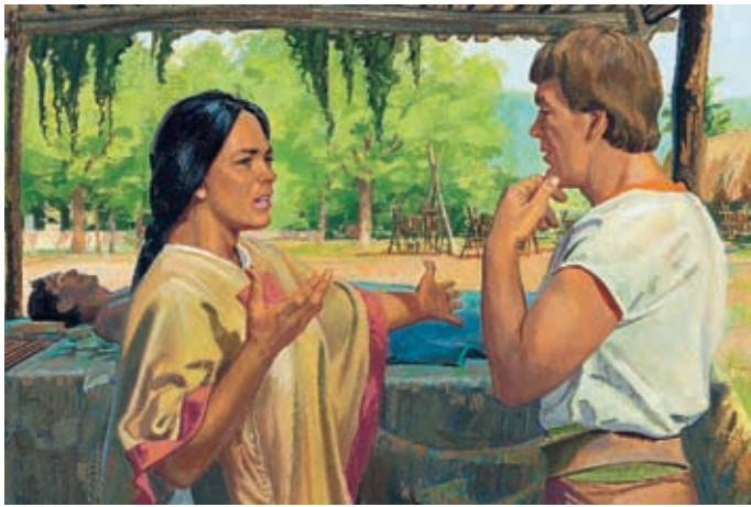
La regina non credeva che il marito fosse morto. Avendo sentito parlare del grande potere di Ammon, gli chiese di aiutare il re. Alma 19:2–5