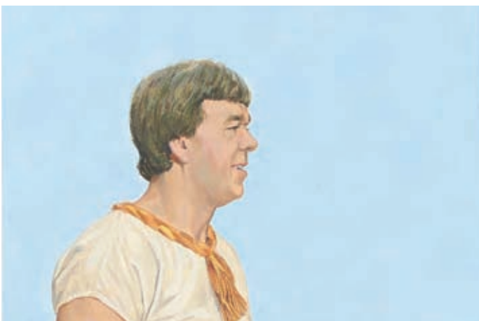
Ammon sait que c'est pour lui l'occasion d'utiliser le pouvoir de Dieu afin de gagner la confiance des Lamanites. Ensuite, ils écouteront son message. Alma 17:29