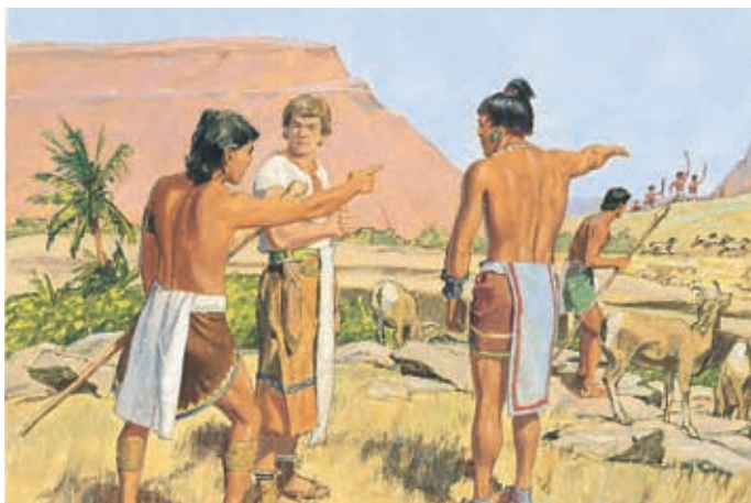
Les voleurs lamanites reviennent. Ammon dit aux autres serviteurs de garder les troupeaux pendant qu'il se bat avec les voleurs. Alma 17:33