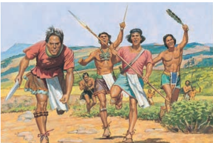
Les voleurs lamanites n'ont pas peur d'Ammon. Ils pensent qu'ils peuvent facilement le tuer. Alma 17:35