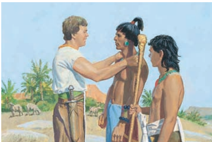
Ammon dit aux serviteurs que s'ils rassemblent les animaux dispersés, le roi ne les fera pas mourir. Alma 17:31