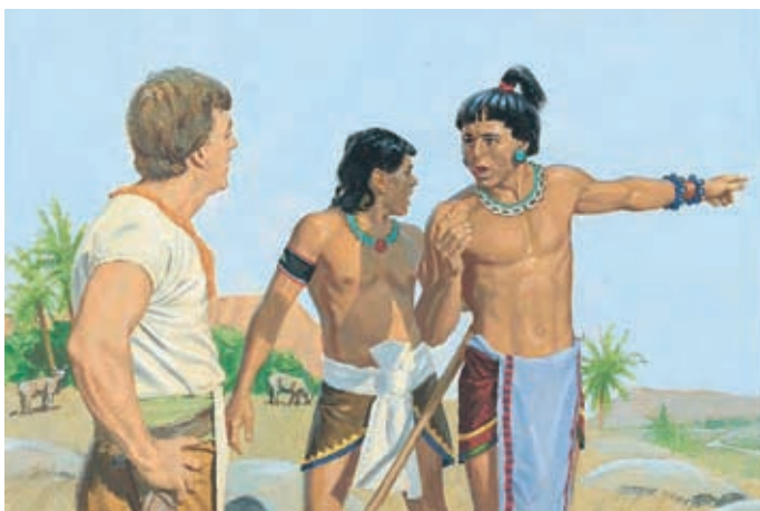
Les serviteurs qui sont avec Ammon ont peur. Le roi Lamani a fait tuer d'autres serviteurs qui ont laissé ces voleurs prendre des animaux. Alma 17:28