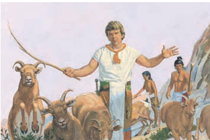
Ammon et les autres serviteurs retrouvent rapidement les animaux et les ramènent au point d'eau. Alma 17:32