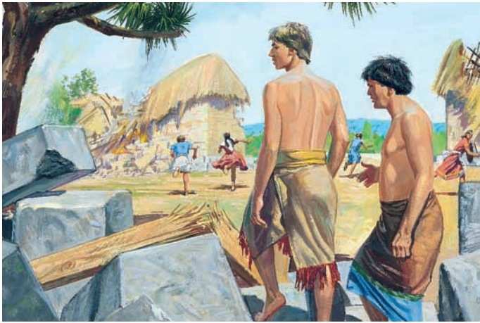
Die Leute von Ammonihä kamen herbei, um zu sehen, was da geschah. Als sie Alma und Amulek aus dem zusammengestürzten Gefängnis kommen sahen, bekamen sie Angst und liefen davon. Alma 14:28,29.