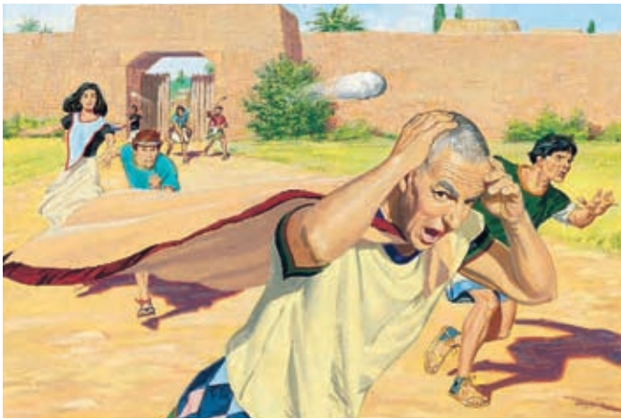
Zeözrom und die anderen, die an Almas und Amuleks Lehren glaubten, wurden aus der Stadt gejagt. Die schlechten Menschen warfen Steine nach ihnen. Alma 14:7.