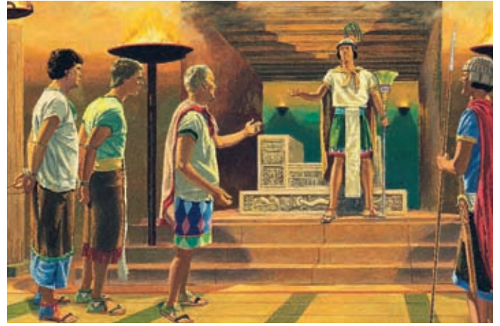
Zeözrom tat es sehr leid, daß er so schlecht gewesen war und die Leute belogen hatte. Er flehte sie an, Alma und Amulek freizulassen. Alma 14:6,7.