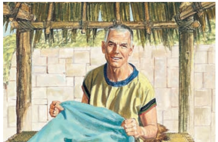
Zezrom glaubte an Jesus Christus und war von seinen Sünden umgekehrt. Als Alma für ihn betete, wurde Zezrom sofort gesund. Alma 15:10,11.