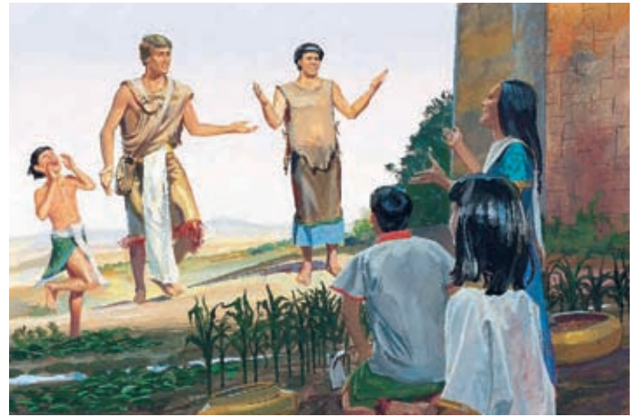
Der Herr sagte zu Alma und Amulek, sie sollten nach Sidon gehen. Dort fanden sie die rechtschaffenen Leute aus Ammonihä. Auch Zezrom war dabei. Er war sehr krank. Alma 15:1–3.