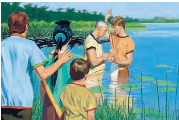
Zezrom wurde getauft und begann, das Evangelium zu verkündigen. Viele andere Menschen ließen sich auch taufen. Alma 15:12,14.