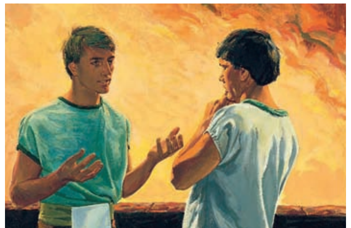
Alma sagte ihm aber, daß sie dem Töten kein Ende bereiten sollten, weil die Sterbenden bald bei Gott sein würden und die schlechten Menschen dafür noch bestraft würden. Alma 14:11.