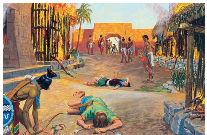
Die schlechten Menschen von Ammonihä wurden alle von einem lamanitischen Heer umgebracht, wie Alma es prophezeit hatte. Alma 10:23; 16:2,9.