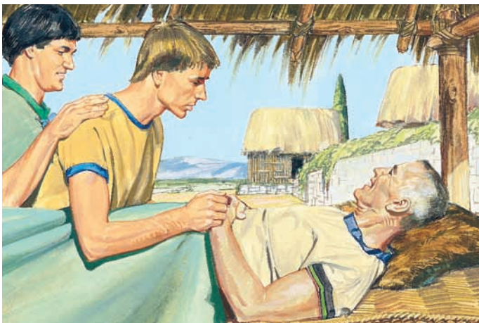
Zezrom freute sich, als er Alma und Amulek sah. Er hatte befürchtet, daß sie durch seine Schuld umgekommen seien. Er bat sie, ihn zu heilen. Alma 15:4,5.