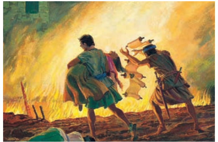
Dann holten die schlechten Menschen die gläubigen Frauen und Kinder zusammen und warfen sie zusammen mit den heiligen Schriften ins Feuer. Alma 14:8.