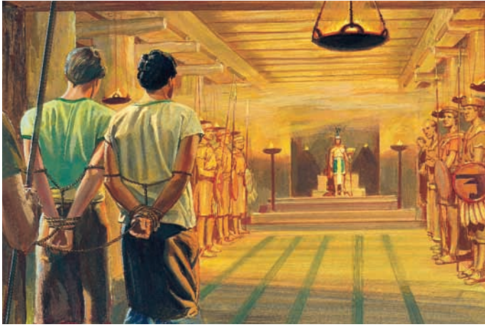
Aber die meisten Leute wollten Alma und Amulek umbringen. Sie fesselten die beiden und brachten sie vor ihren obersten Richter. Alma 14:2-4.