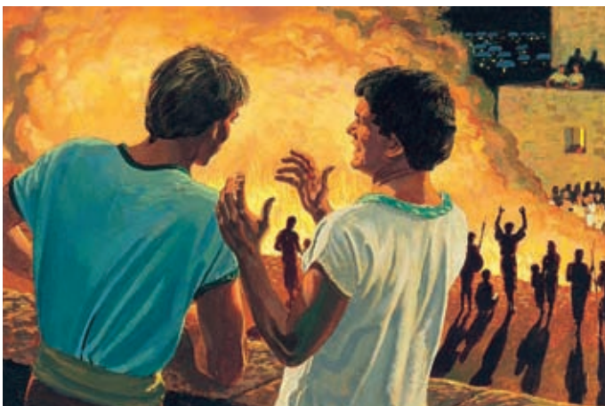
Alma und Amulek mußten zusehen, wie die Frauen und Kinder im Feuer starben. Amulek wollte sie durch Gottes Macht retten. Alma 14:9,10.