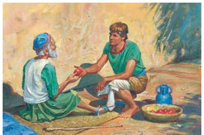
I membri della Chiesa dividevano ciò che avevano con i poveri e si curavano degli infermi. Essi obbedivano ai comandamenti e Dio li benediva. Alma 1:27, 31