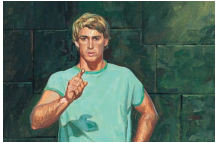
Alma disse che Nehor doveva essere punito per aver ucciso Gedeone. Secondo la legge Nehor doveva morire. Alma 1:14