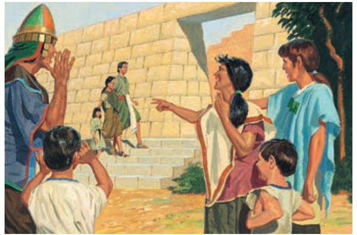
Quelle persone amavano le ricchezze del mondo e non volevano obbedire ai comandamenti di Dio. Deridevano i membri della Chiesa e disputavano e combattevano con loro. Alma 1:16, 19–20, 22