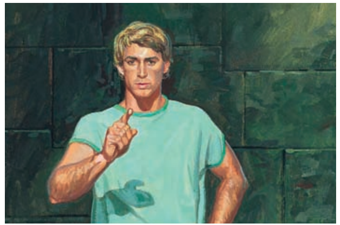
Alma dit que Néhor doit être puni pour avoir tué Gidéon. D'après la loi, Néhor doit mourir. Alma 1:14