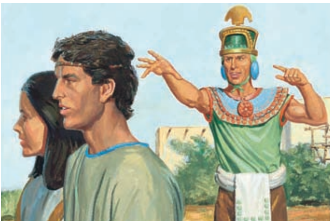
Les justes continuent à obéir aux commandements de Dieu et ne se plaignent pas, même lorsque les disciples de Néhor leur font du tort. Alma 1:25