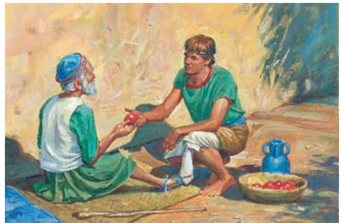
Les membres de l'Eglise partagent tout leurs biens avec les pauvres et ils s'occupent des malades. Ils obéissent aux commandements et Dieu les bénit. Alma 1:27, 31