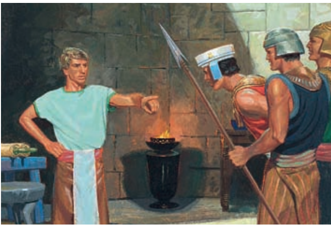
Mais Alma dit que Néhor est coupable parce qu'il a enseigné au peuple à être méchant et qu'il a tué Gidéon. Alma 1:12–13