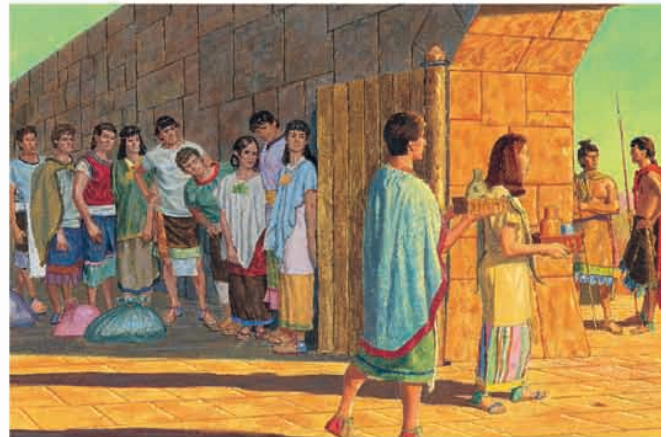
Naquela noite, o rei Lími mandou-lhes vinho de presente. Mosias 22:10