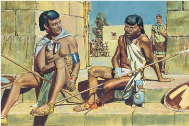
Os nefitas descobriram que os guardas da cidade geralmente embebedavam-se à noite. Mosias 22:6