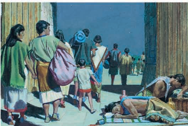
O rei Lími e seu povo passaram pelos guardas que estavam bêbados e fugiram. Mosias 22:11