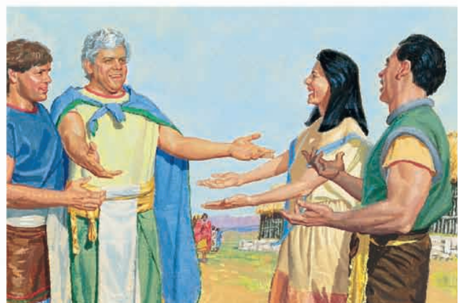
Amon guiou o rei Lími e seu povo pelo deserto até Zarena, onde foram acolhidos. Mosias 22:13-14