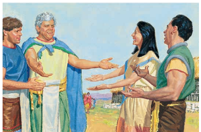
Ammon condusse re Limhi e il suo popolo attraverso il deserto fino a Zarahemla, dove furono accolti con gioia. Mosia 22:13-14