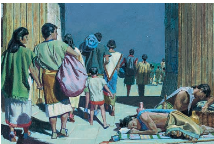
Re Limhi e il suo popolo riuscirono a passare accanto alle guardie ubriache e a fuggire. Mosia 22:11