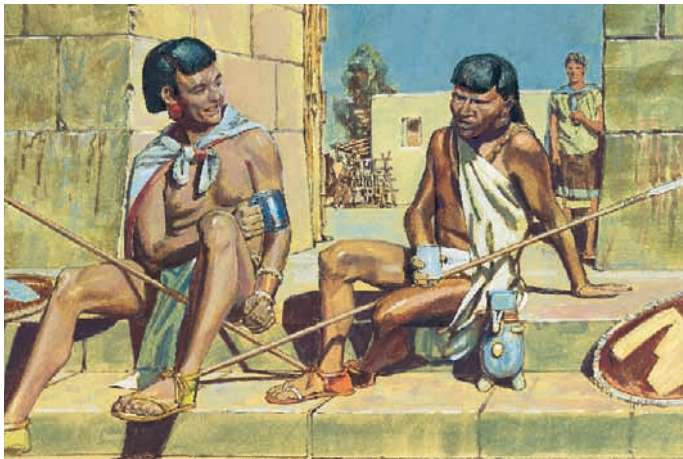
I Nefiti scoprirono che i Lamaniti di guardia alla città di solito la notte si ubriacavano. Mosia 22:6