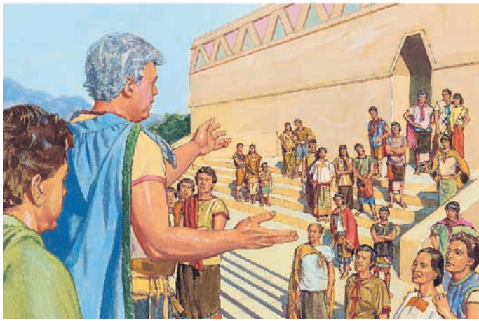
Re Limhi radunò il suo popolo e ricordò loro che la loro malvagità era il motivo per cui erano tenuti schiavi dai Lamaniti. Mosia 7:17, 20