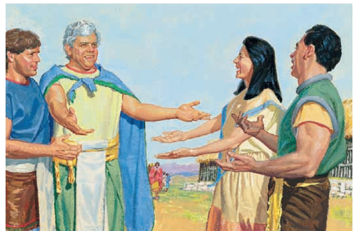
Ammon fait traverser le désert au roi Limhi et à son peuple et l'amène à Zarahemla, où ils sont accueillis. Mosiah 22:13-14