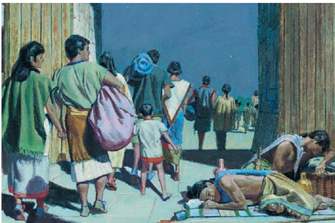
Le roi Limhi et son peuple peuvent passer devant les gardes saouls et s'échapper. Mosiah 22:11