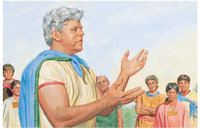
Er sagte seinem Volk, wenn sie umkehrten, Glauben hätten und die Gebote befolgten, werde Gott ihnen helfen zu fliehen. Mosia 7:19,33.