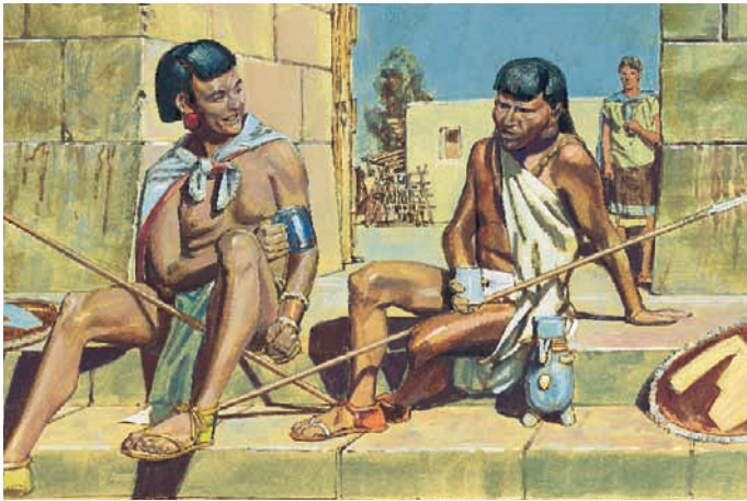
Die Nephiten erfuhren, daß die Lamaniten, die sie bewachten, nachts fast immer betrunken waren. Mosia 22:6.