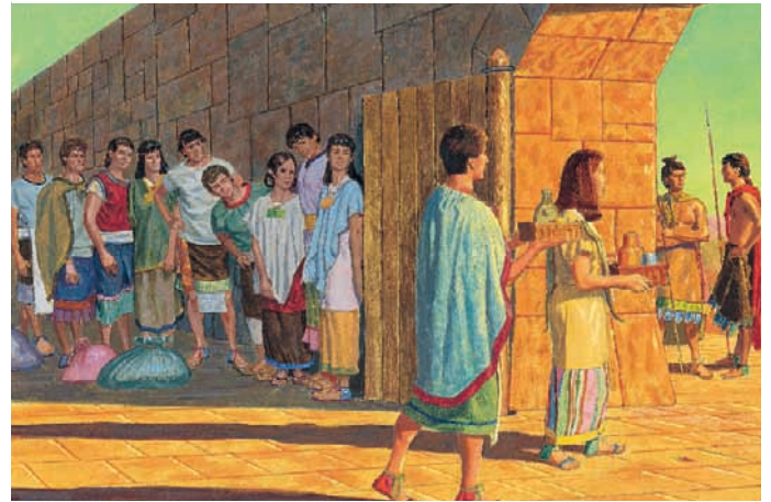
An diesem Abend ließ König Limhi den Wachen Wein als Geschenk senden. Mosia 22:10.