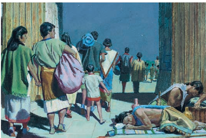
König Limhi und sein Volk konnten sich an den betrunkenen Wachen vorbeischieben und entkommen. Mosia 22:11.