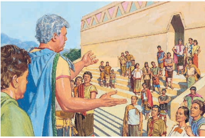
林海王召集他的人民，並提醒他們，他們被拉曼人統治是因為他們曾經很邪惡。 摩賽亞書7：17，20