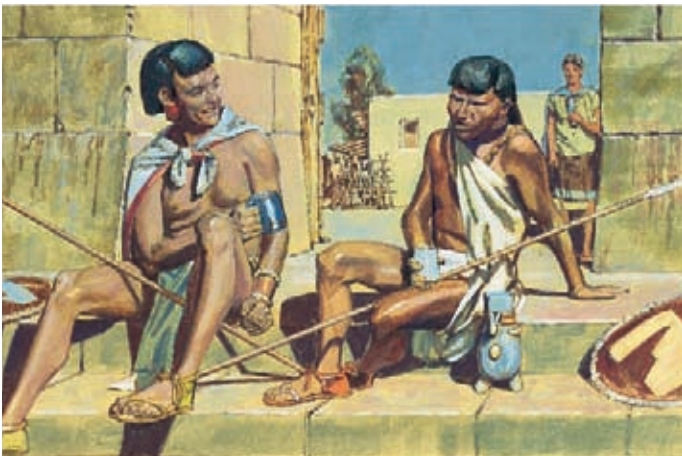
尼腓人知道，看守城市的拉曼人通常會在晚上喝得醉醺醺的。 摩賽亞書22：6