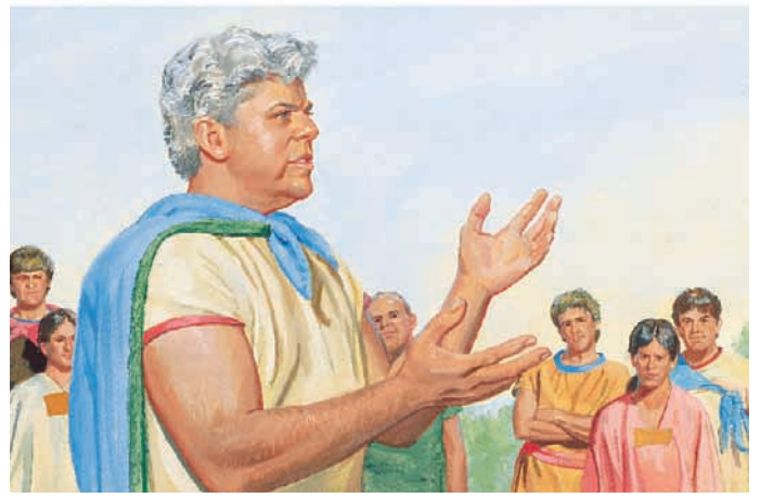
他要人民悔改、信賴神、並遵守誠命，這樣神就會幫助他們逃走。 摩賽亞書7：19，33