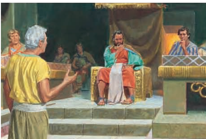
Abinadi wurde vor den König gebracht. König Noa und seine Priester stellten ihm viele Fragen. Sie versuchten, ihm eine Falle zu stellen, damit er etwas Falsches sagte. Mosia 12:18,19.