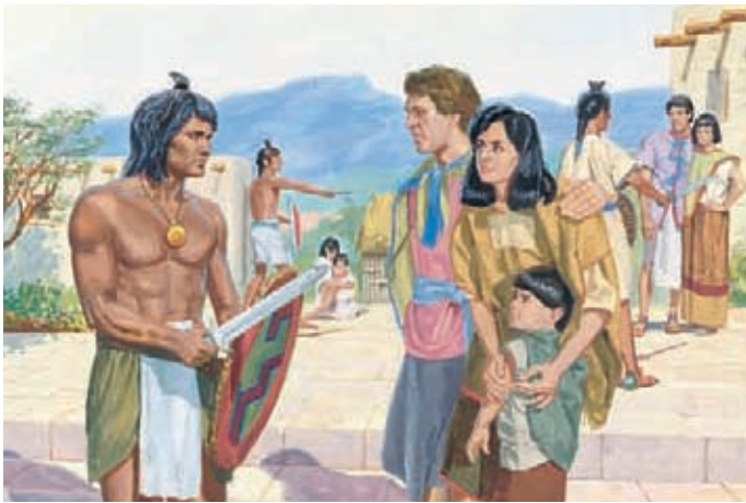
Viele Männer wollten nicht weglaufen. Sie wurden von den Lamaniten gefangen genommen. Mosia 19:12,15.