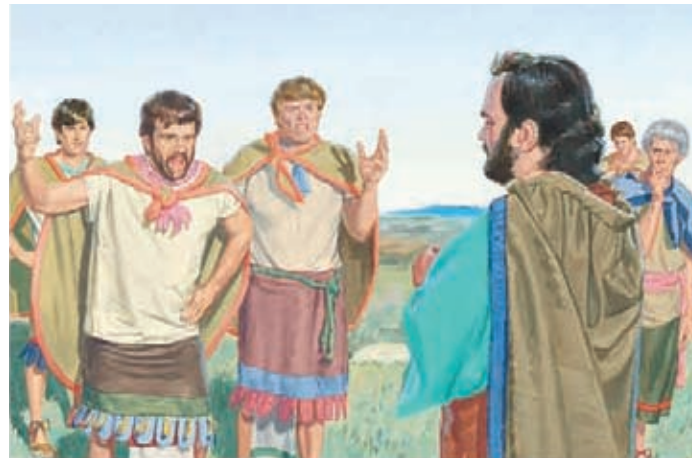
Den meisten Männern, die mit König Noa geflohen waren, tat es leid, daß sie ihre Familien zurückgelassen hatten. Sie wollten umkehren und ihnen und ihrem Volk helfen. Mosia 19:19.