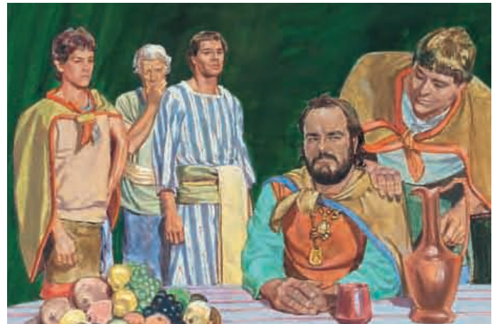
Als König Noa das hörte, wurde er sehr zornig. Er schickte Männer aus, die Abinadi zum Palast bringen sollten, damit er ihn töten konnte. Mosia 11:27,28.