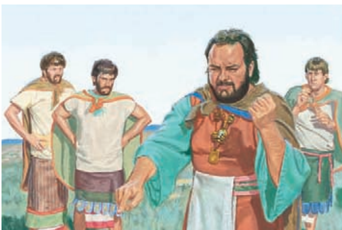
König Noa wollte nicht, daß die Männer zu ihren Familien zurückgingen. Er befahl ihnen, bei ihm zu bleiben. Mosia 19:20.