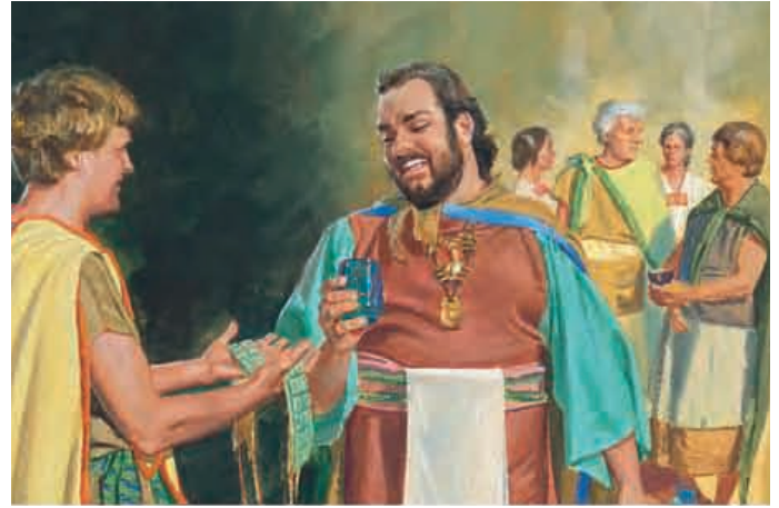
König Noa hängte sein Herz an die Reichtümer, die er von seinem Volk erhielt. Er und seine Priester tranken die ganze Zeit Wein und waren schlecht. Mosia 11:14,15.