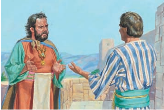
Der Priester, der Abinadi glaubte, hieß Alma. Er bat König Noa, Abinadi freizulassen.