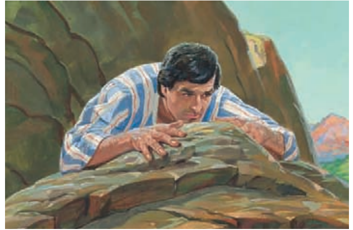
Der König wurde zornig auf Alma und ließ ihn hinauswerfen. Dann schickte er ihm seine Knechte nach, um ihn zu töten. Aber Alma lief fort und versteckte sich, so daß die Knechte ihn nicht fanden.