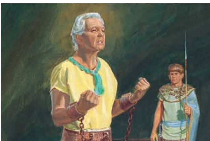
Abinadi wußte, daß er die Wahrheit gesprochen hatte. Er wollte lieber sterben als das zurücknehmen, was er nach Gottes Willen gesagt hatte.