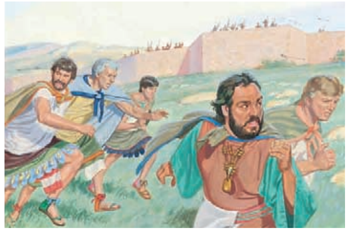
Der König und seine Anhänger flohen vor den Lamaniten, aber diese holten sie ein und begannen, sie zu erschlagen. Da befahl der König seinen Männern, ihre Familien im Stich zu lassen und mit ihm zu fliehen. Mosia 19:9-11.