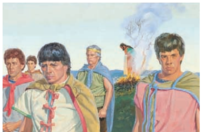
Die Männer wurden zornig auf den König. Sie verbrannten ihn, wie Abinadi es prophezeit hatte. Dann kehrten sie zu ihren Familien zurück. Mosia 19:20,24.