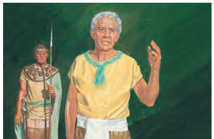
Abinadi fürchtete sich nicht vor ihren Fragen. Er wußte, daß Gott ihm helfen würde. Die Priester staunten über Abinadis Antworten. Mosia 12:19.