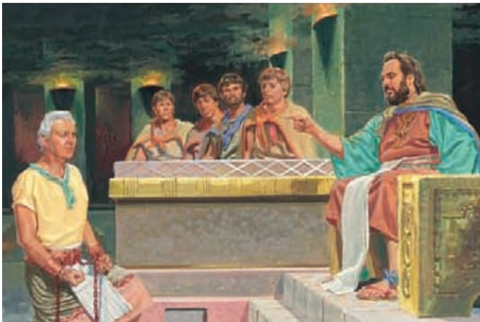
Nach drei Tagen im Gefängnis wurde Abinadi wieder vor König Noa geführt. Der König forderte Abinadi auf, das zurückzunehmen, was er gegen ihn und sein Volk gesagt hatte.