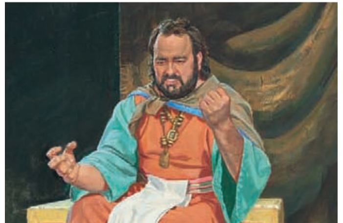
König Noa sagte, wenn Abinadi nicht alles widerriefe, was er gesagt hatte, würde er getötet.