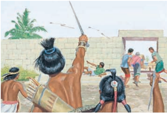
Einige Nephiten lehnten sich gegen König Noa auf und versuchten, ihn zu töten. Außerdem kam ein lamanitisches Heer, um gegen König Noa und seine Anhänger zu kämpfen. Mosia 19:2-7.