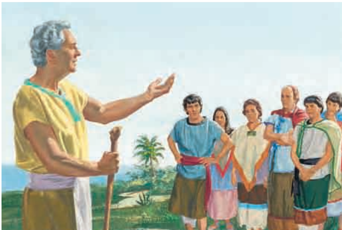
Da sandte Gott zu Noas Volk einen Propheten, der Abinadi hieß. Abinadi warnte sie: wenn sie nicht umkehrten, würden sie Sklaven der Lamaniten werden. Mosia 11:20–22.