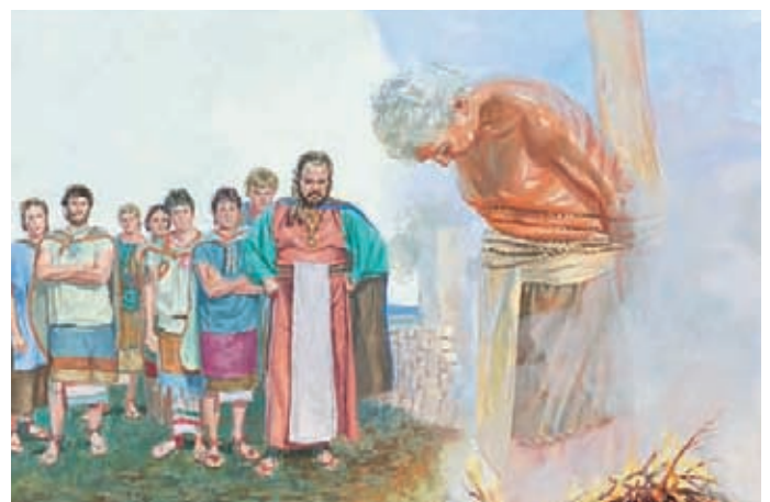
König Noa befahl seinen Priestern, Abinadi zu töten. Sie fesselten ihn, schlugen ihn und verbrannten ihn. Ehe Abinadi starb, sagte er, daß auch König Noa durch Feuer sterben werde.