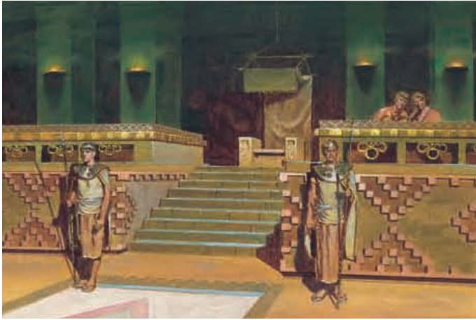
König Noa ließ viele prächtige Gebäude bauen, darunter auch einen großen Palast mit einem Thron darin. Die Gebäude waren mit Gold und Silber und wertvollen Hölzern verziert. Mosia 11:8–11.