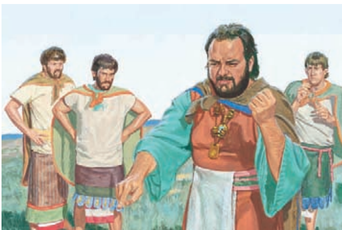
挪亞王不准他們回到家人那裡，他命令他們留在他身邊。 摩賽亞書19：20