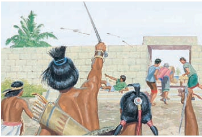
有些尼腓人反對挪亞王，想殺死他，拉曼人的軍隊也來攻打挪亞王和跟隨他的人。 摩賽亞書19：2-7