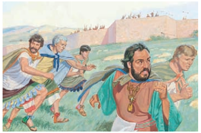
挪亞王和他的人民想逃離拉曼人，可是被他們追上了，並開始要殺他們。挪亞王要男人們拋棄家庭，繼續逃跑。 摩賽亞書19：9-11