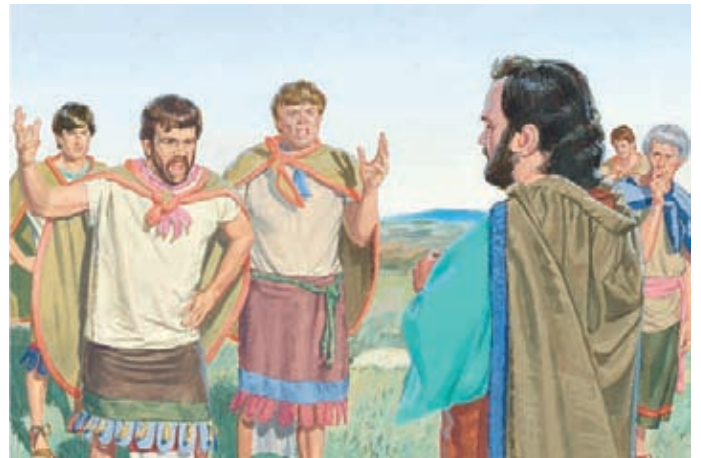
大部分和挪亞王一起逃走的人都很後悔，他們想回去拯救他們的妻子、兒女和人民。