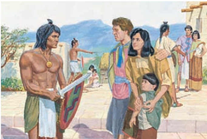
許多男人不願意離開，於是都被拉曼人抓走了。 摩賽亞書19：12，15