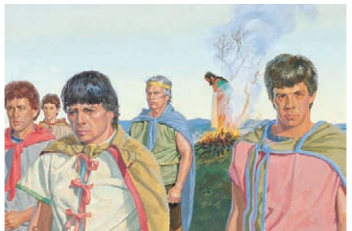
這些人很氣挪亞王，便把他燒死，一切就像阿賓納代所預言的一樣。然後他們就回到他們的家人那裡去。