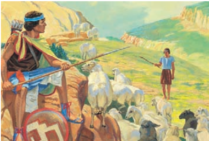
Dopo la battaglia Zeniff mise delle sentinelle attorno alle città nefite. Voleva proteggere il suo popolo e gli animali dai Lamaniti. Mosia 10:2