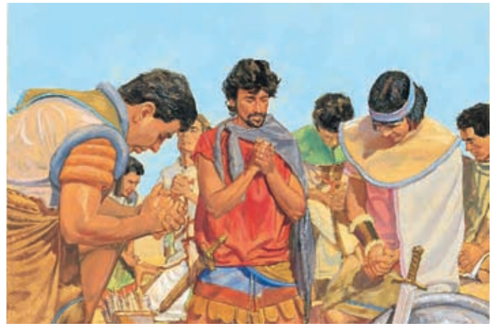
Prima di combattere i Nefiti pregarono, chiedendo l'aiuto di Dio. Il Signore concesse grande forza ai Nefiti ed essi sconfissero i Lamaniti. Mosia 9:17-18