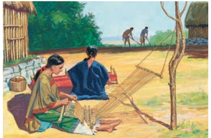
I Nefiti vissero in pace per molti anni. Gli uomini lavoravano nei campi e le donne tessavano e cucivano vestiti. Mosia 10:4-5