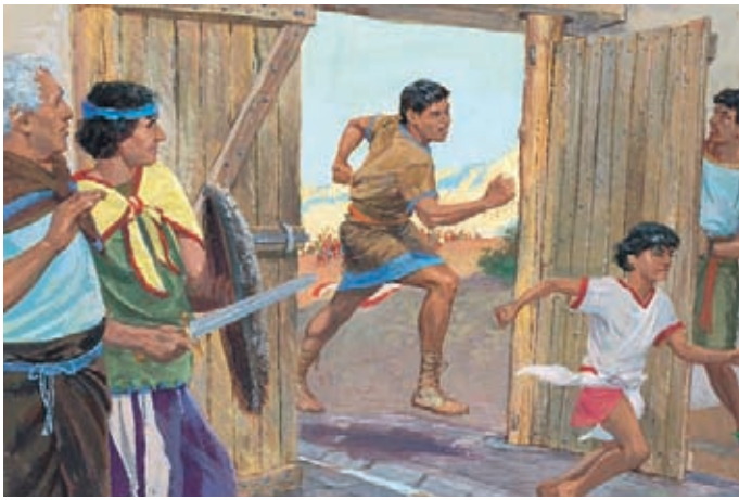
I Nefiti si rifugiarono nella città di Nefi. Là Zeniff armò il popolo di archi e frecce, spade, bastoni e fionde. Essi andarono a combattere i Lamaniti. Mosia 9:15-16