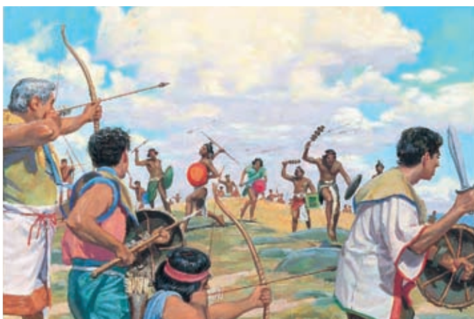
Le roi Laman meurt et son fils devient roi. Le nouveau roi envoie son armée combattre les Néphites. Mosiah 10:6, 8-9