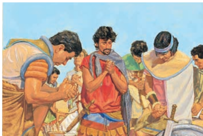
Avant le combat, les Néphites prient pour demander à Dieu de les aider. Dieu donne plus de force aux Néphites et ils sont vainqueurs des Lamanites. Mosiah 9:17-18