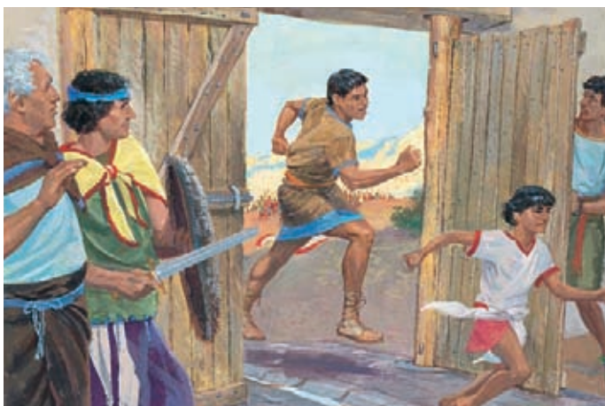
Les Néphites se précipitent vers la ville de Néphi. Là, Zéniff arme le peuple d'arcs, de flèches, de bâtons, d'épées et de frondes. Ils partent combattre les Lamanites. Mosiah 9:15-16