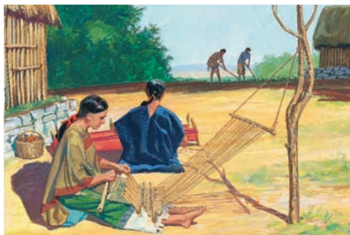
Les Néphites vivent en paix pendant de nombreuses années. Les hommes travaillent dans les champs et les femmes filent et fabriquent des vêtements. Mosiah 10:4-5