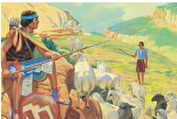
Après la bataille, Zéniff place des gardes autour des villes néphites. Il veut protéger son peuple et leur bétail des Lamanites. Mosiah 10:2