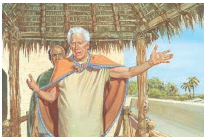
Он велел родителям не позволять своим детям драться или спорить. Мосия 4:14