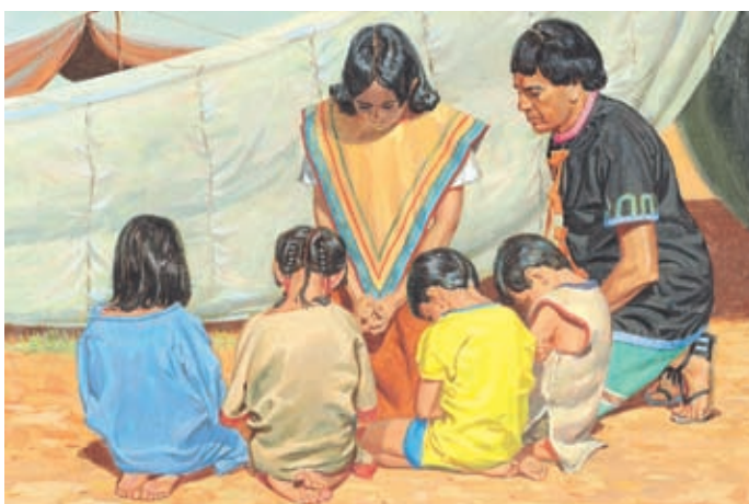
Царь Вениамин велел людям быть скромными и каждый день молиться. Он хотел, чтобы его народ всегда помнил Бога и был преданным. Мосия 4:10–11