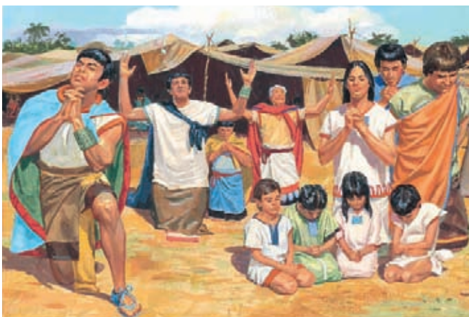
Après les paroles du roi Benjamin, les Néphites tombent par terre. Ils regrettent d'avoir péché et veulent se repentir. Mosiah 4:1-2