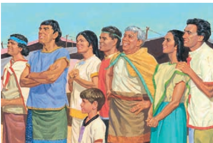
Le Saint-Esprit remplit leur cœur. Ils savent que Dieu leur a pardonné et qu'il les aime. Ils ressentent de la paix et de la joie. Mosiah 4:3