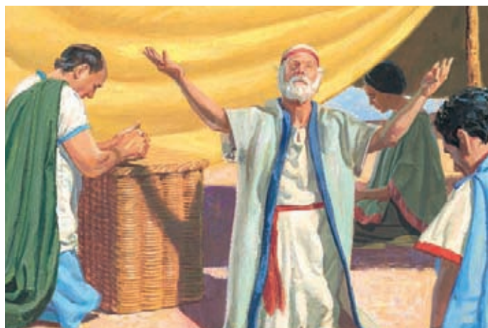
Les gens ont foi en Jésus-Christ et ils prient pour être pardonnés. Mosiah 4:2