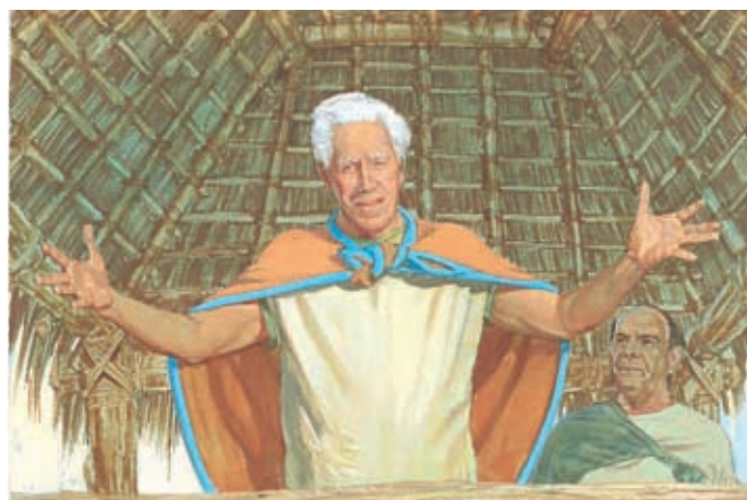
Le roi Benjamin dit à son peuple de croire en Dieu. Il veut qu'il sache que Dieu a créé toutes choses et qu'il est sage et puissant. Mosiah 4:9