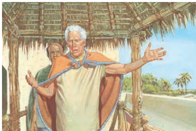
Il dit aux parents de ne pas laisser leurs enfants se battre ou se disputer. Mosiah 4:14