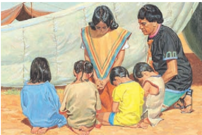
Le roi Benjamin dit aux gens d'être humbles et de prier tous les jours. Il veut que son peuple se souvienne toujours de Dieu et qu'il soit fidèle. Mosiah 4:10-11