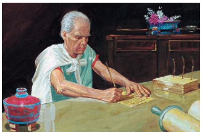
Enos verbrachte sein ganzes Leben damit, die Nephiten über Jesus und das Evangelium zu belehren. Er liebte Gott und diente ihm sein Leben lang. Enos 1:26,27.