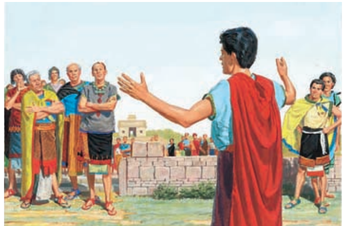
Enos predigte den Nephiten. Er wünschte sich, daß sie an Gott glaubten und seine Gebote befolgten. Enos 1:10,19.