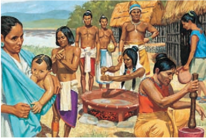
Enos wünschte sich auch, daß der Herr die Lamaniten segnete. Er betete mit großem Glauben, und der Herr versprach, seine Bitte zu erfüllen. Enos 1:11,12.