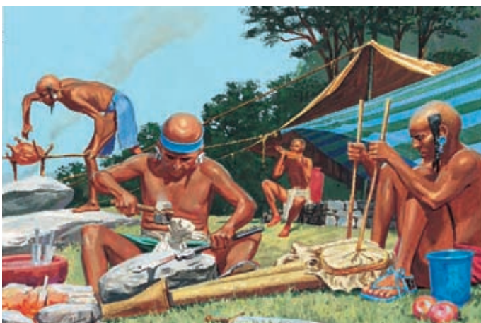
Die Nephiten versuchten, den Lamaniten das Evangelium zu predigen, aber diese wollten nicht zuhören. Die Lamaniten haßten die Nephiten. Enos 1:20.