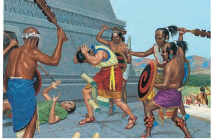
Die Lamaniten kämpften zwar gegen die Nephiten und wollten ihre Aufzeichnungen vernichten, aber Enos betete, daß sie ein rechtschaffenes Volk werden würden. Enos 1:13,14.