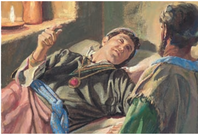
Scherem war ganz schwach und wußte, daß er sterben würde. Er rief das Volk zusammen. Jakob 7:16.