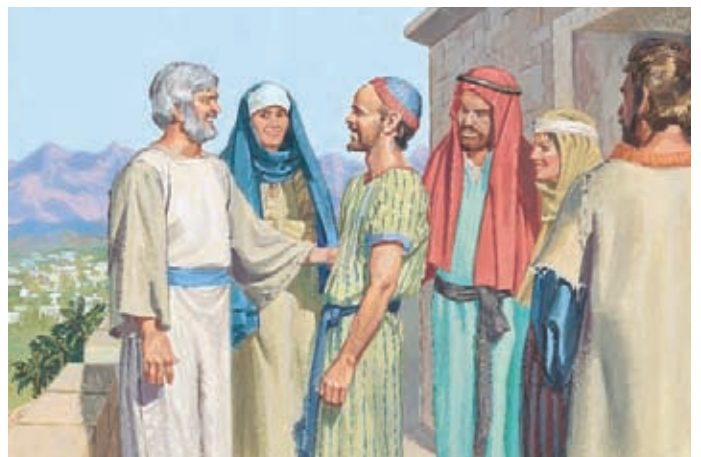
Die Menschen fingen an, umzukehren und in der Schrift zu lesen. Sie lebten in Liebe und Frieden. Jakob war sehr froh und wußte, daß Gott seine Gebete erhört hatte. Jakob 7:22,23.