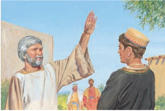
Jakob sagte weiter, wenn Gott Scherem schlage, so sei das ein Zeichen für die Macht Gottes. Jakob 7:14.