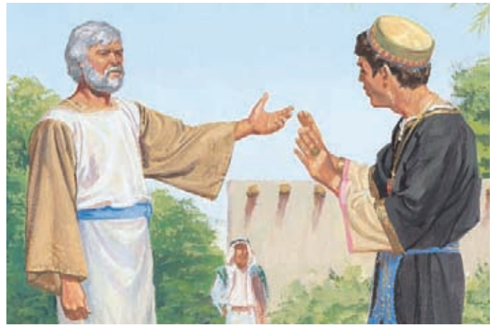
Der Heilige Geist war bei Jakob, als dieser Scherem Zeugnis von Jesus Christus gab. Jakob 7:8-12.