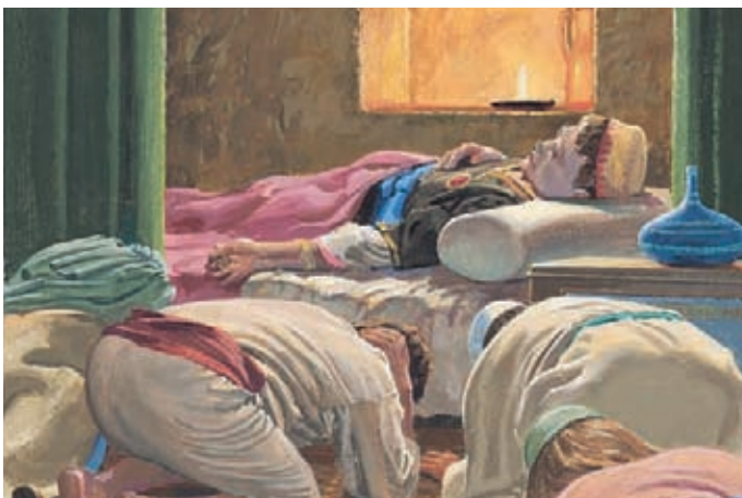
Nachdem Scherem das zum Volk gesagt hatte, starb er. Die Menschen spürten die Macht Gottes und fielen zu Boden. Jakob 7:20,21.