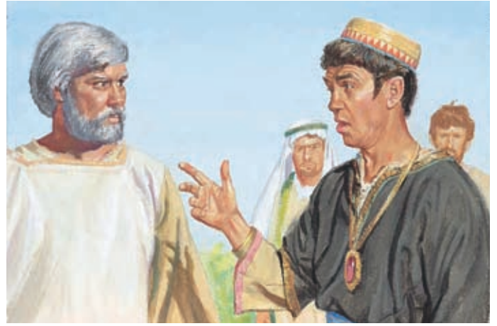
Jakob lehrte die Menschen, an Christus zu glauben. Scherem wollte mit Jakob streiten und ihn überzeugen, daß es keinen Christus geben werde. Jakob 7:6.