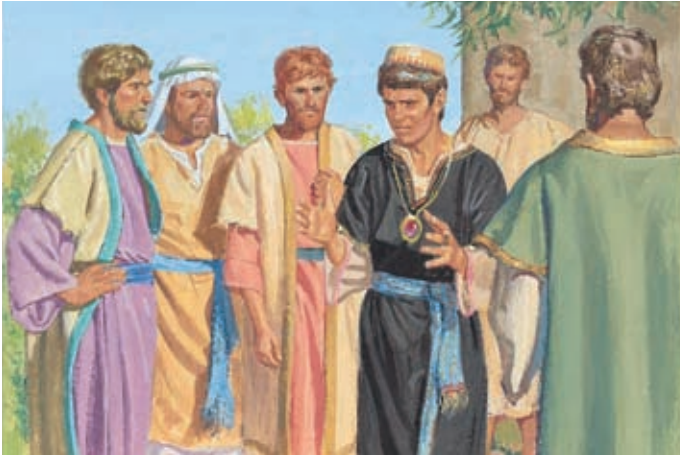
Scherem sagte, daß es keinen Christus geben würde. Viele Leute glaubten ihm. Jakob 7:2,3.