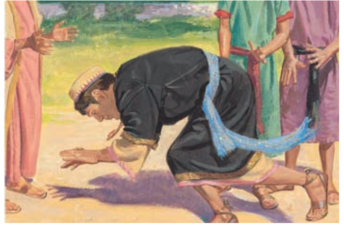
Scherem fiel sofort zu Boden. Er konnte viele Tage lang nicht aufstehen. Jakob 7:15.