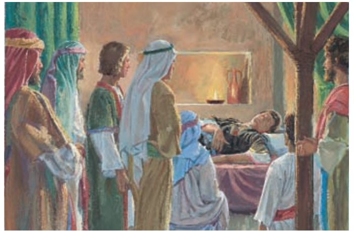
Er sagte ihnen, daß er gelogen habe. Er sagte, sie sollten an Jesus Christus glauben. Jakob 7:17-19.