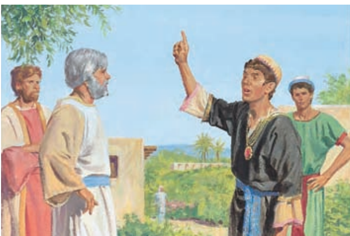
Scherem wollte ein Zeichen haben. Jakob sollte ihm beweisen, daß es einen Gott gibt. Er wollte ein Wunder sehen. Jakob 7:13.