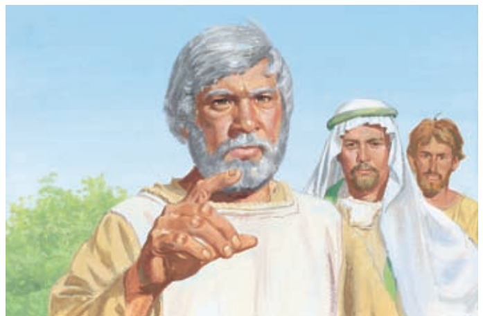
雅各說他不會要求神顯現神蹟。他說歇雷早已知道雅各的教導是正確的。 雅各書7：14