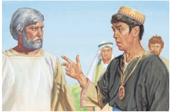
雅各教導人民要相信基督。歇雷想和他爭辯，讓雅各相信沒有基督。 雅各書7：6