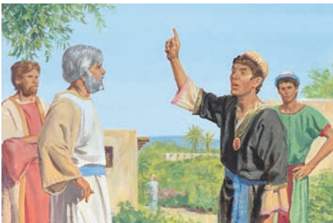
歇雷要求看神蹟。他要雅各證明神的存在，想看奇蹟。 雅各書7：13