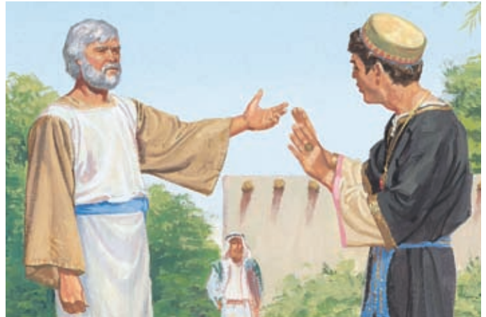
當雅各對歇雷說出他對耶穌基督的見證時，聖靈與他同在。 雅各書7：8-12