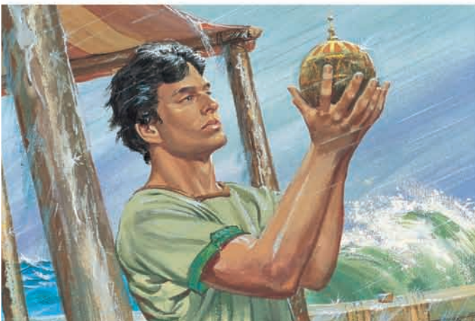
Néfi pegou a Liahona, e ela voltou a funcionar. Néfi orou, e o vento parou. O mar acalmou-se. 1 Néfi 18:21