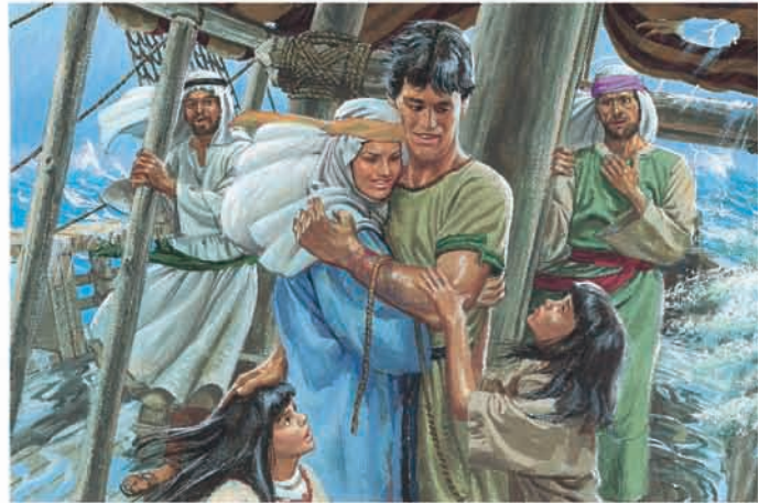
Finalmente, Lamã e Lemuel arrependeram-se e desamarraram Néfi. Apesar de seus pulsos e tornozelos estarem inchados e doloridos por causa das cordas, Néfi não se queixou de nada. 1 Néfi 18:15–16