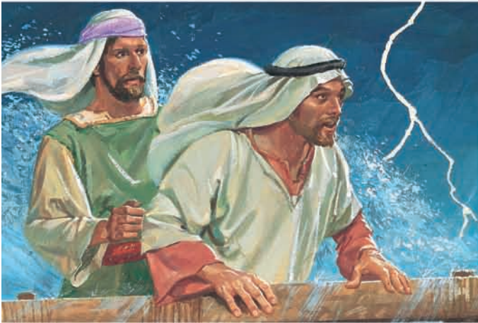
Lamã e Lemuel sabiam que Deus havia mandado a tempestade. Eles ficaram com medo de se afogar. 1 Néfi 18:14–15