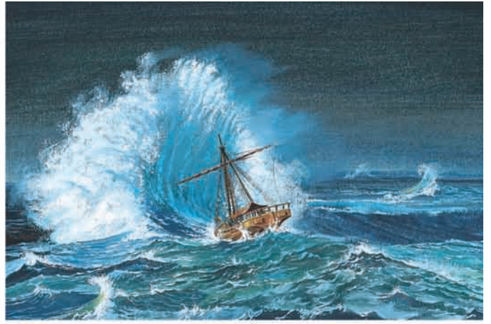
No quarto dia, a tempestade piorou, e o navio estava prestes a afundar. 1 Néfi 18:14–15