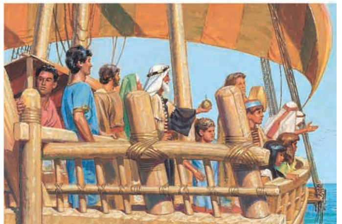
Néfi conduziu o navio em direção à terra prometida. 1 Néfi 18:22