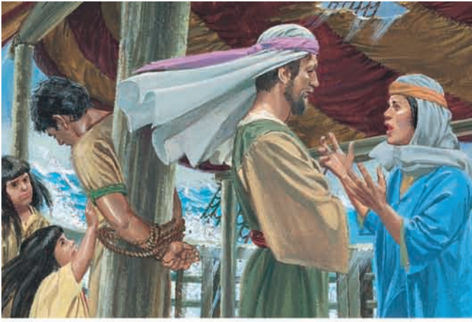
Os filhos e a mulher de Néfi choravam. Eles imploravam a Lamã e Lemuel que desamarrassem Néfi, mas eles recusavam-se. 1 Néfi 18:19