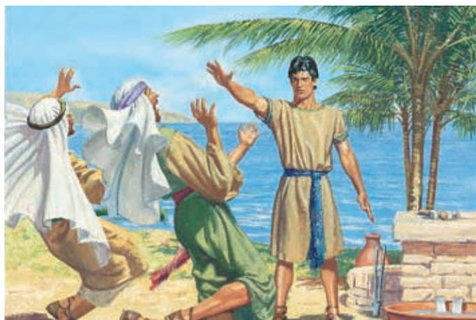
Le Seigneur dit alors à Néphi de toucher Laman et Lémuel. Lorsque Néphi le fait, Laman et Lémuel sont ébranlés par le Seigneur. Ils savent que Néphi a le pouvoir de Dieu. 1 Néphi 17:53–55