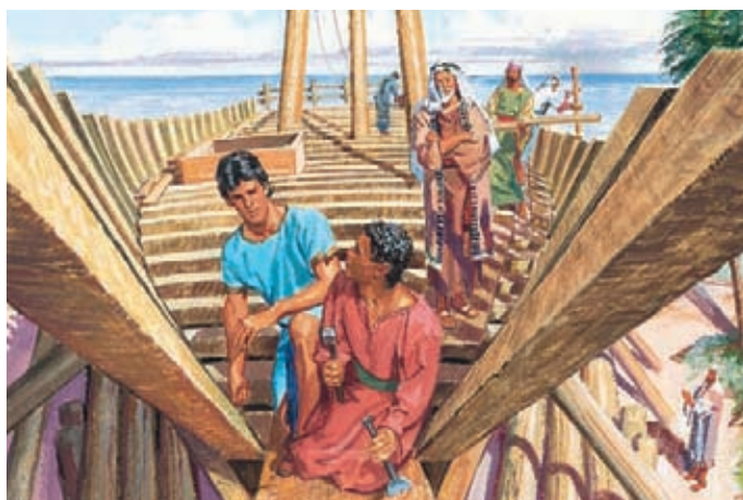
Laman et Lémuel se repentent et aident Néphi à construire le vaisseau. 1 Néphi 18:1