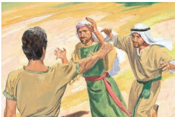
Lorsqu'ils s'approchent de Néphi, il leur commande de ne pas le toucher parce qu'il est rempli du pouvoir de Dieu. Laman et Lémuel ont peur pendant plusieurs jours. 1 Néphi 17:48, 52