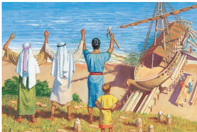
Lorsque Néphi et ses frères ont fini la construction du vaisseau, ils savent que c'est un bon vaisseau. Ils remercient Dieu de les avoir aidés. 1 Néphi 18:4