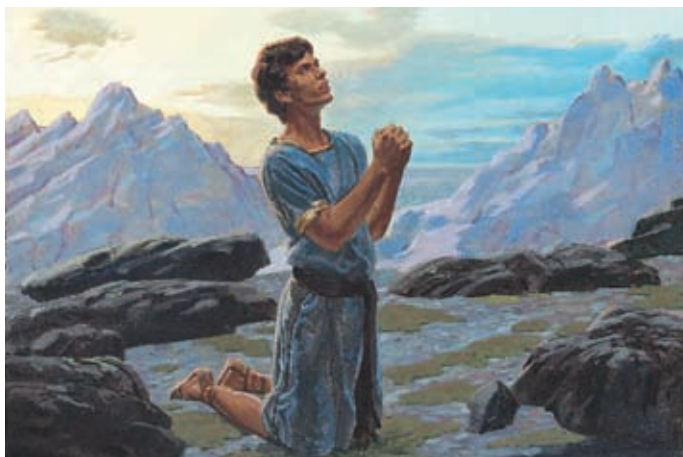
Néphi va de nombreuses fois dans la montagne pour prier et demander de l'aide. Le Seigneur lui apprend comment construire un vaisseau. 1 Néphi 18:3